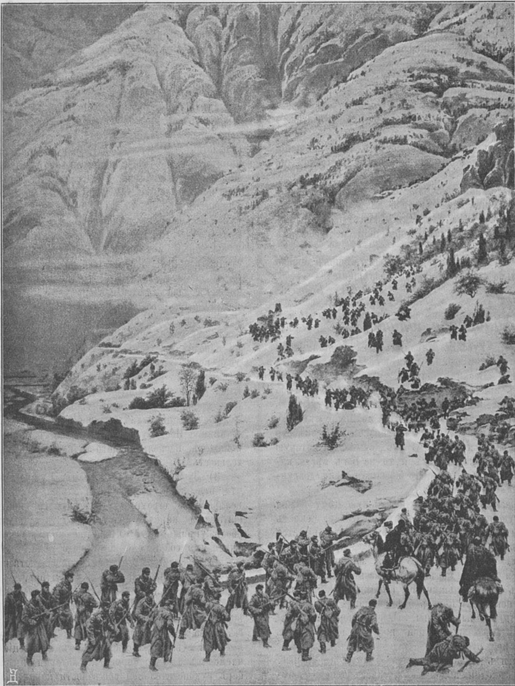
Взятіе штурмомъ укрѣпленныхъ Гаргохотанскихъ высотъ 1 января 1878 г. (съ картины А. Кившенко).

дующимъ обученіемъ понтонному дѣлу въ ротѣ. Самое добросовѣстное стараніе изучить необходимыя детали понтоннаго дѣла по «Наставленію» о понтонной службѣ безъ практики ни къ чему обыкновенно не приводитъ и кончается тѣмъ, что молодой офицеръ придя въ роту, въ часы, назначенные для занятій, ограничивается пассивною ролью, учась самъ у того унтеръ-офицера, который преподаетъ многочисленной аудиторіи понтонныя тайны. А преподаваніе унтеръ-офицерами ведется въ высшей степени своеобразно, если не сказать болѣе. Ежегодно, съ наступленіемъ зимнихъ занятій, понтонное дѣло