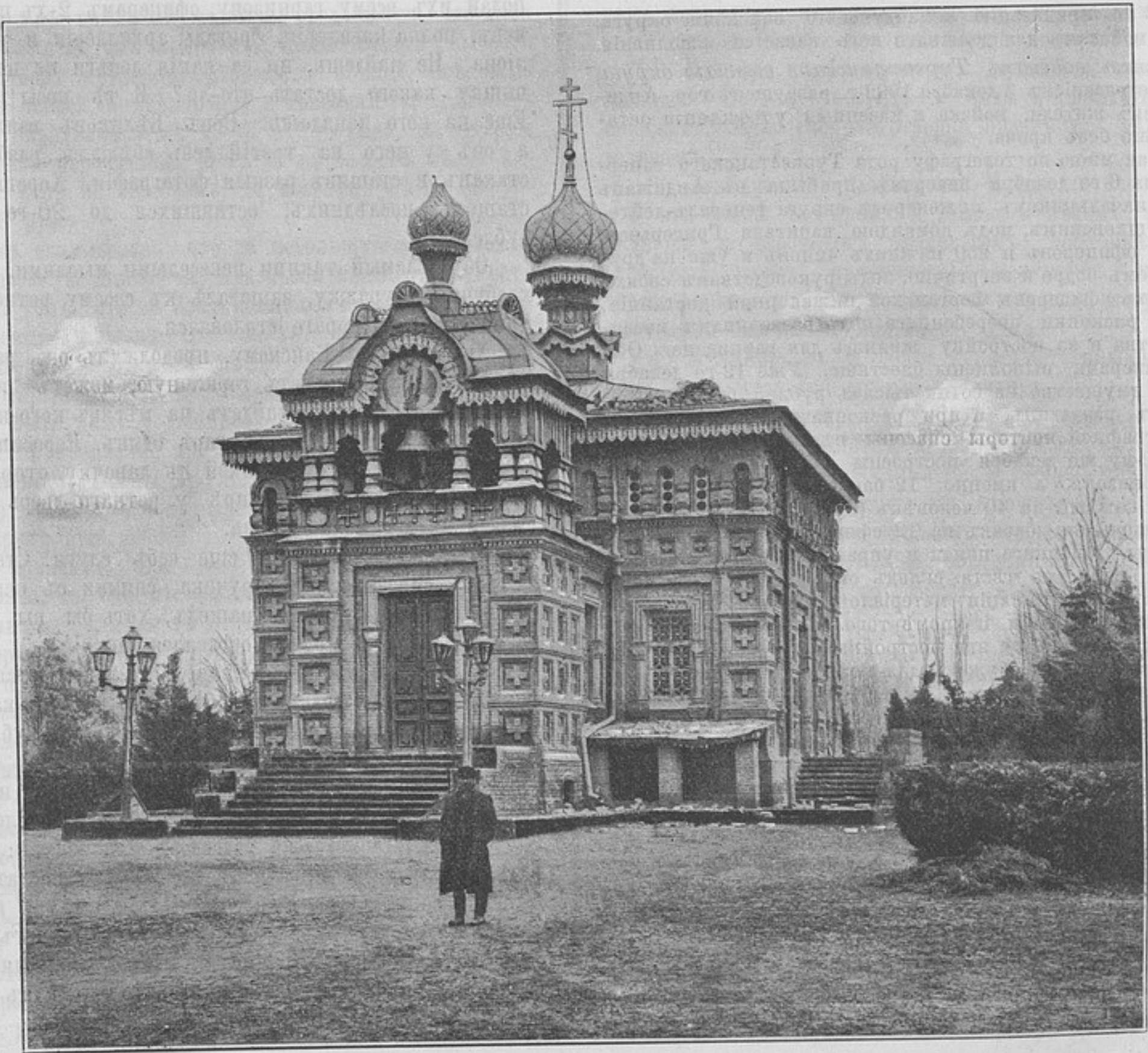
Землетрясеніе въ Андижанѣ. Видъ церкви.