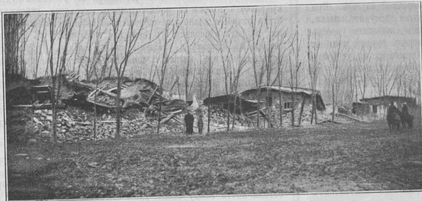
Землетрясеніе въ Андиганѣ. Видъ улицы.

Послѣ этого теоретическаго, такъ сказать, перваго періода обученія начинается второй—упражнение на моделяхъ половиннаго размѣра. Первое упражнение — разборка повозки № 1. Вносятся безколесный станокъ — модель повозки весьма мало напоминающая дѣйствительность, такъ какъ представляетъ собою одновременно и повозку № 2. И при дѣйствительной-то разборкѣ размѣщеніе номеровъ понтонеровъ не отличается особымъ просторомъ. Это видно изъ слѣдующаго: для носки каждого полупонтона назначаются 10 номеровъ, которые размѣщаются по 5-ти съ каждой длинной стороны полупонтона, имѣющаго дѣйствительную (не на моделяхъ) длину 11 футовъ 5 1/2 дюймовъ. Слѣдовательно на каждомъ номерѣ приходится немного болѣе двухъ футовъ, т. е. ширина только-только достаточная для того, чтобы всѣ пять номеровъ могли не толкаясь подойти вплотную къ полупонтону, дружно, одновременно поднять его на плечи (полупонтоны носятся на плечахъ) и затѣмъ, повернувшись въ сторону движенія, идти въ порядкѣ. Возможно ли думать о сохраненіи какого-нибудь порядка (этого необходимаго условія для полученія дѣйствительно поучительной, наглядной картины), когда пятерыхъ человекъ заставить съжаться до нельзя и работать на пространствѣ шириною около фута. Ясно, что солдаты давятъ другъ другу ноги, толкаются, мѣшаютъ одинъ другому, и