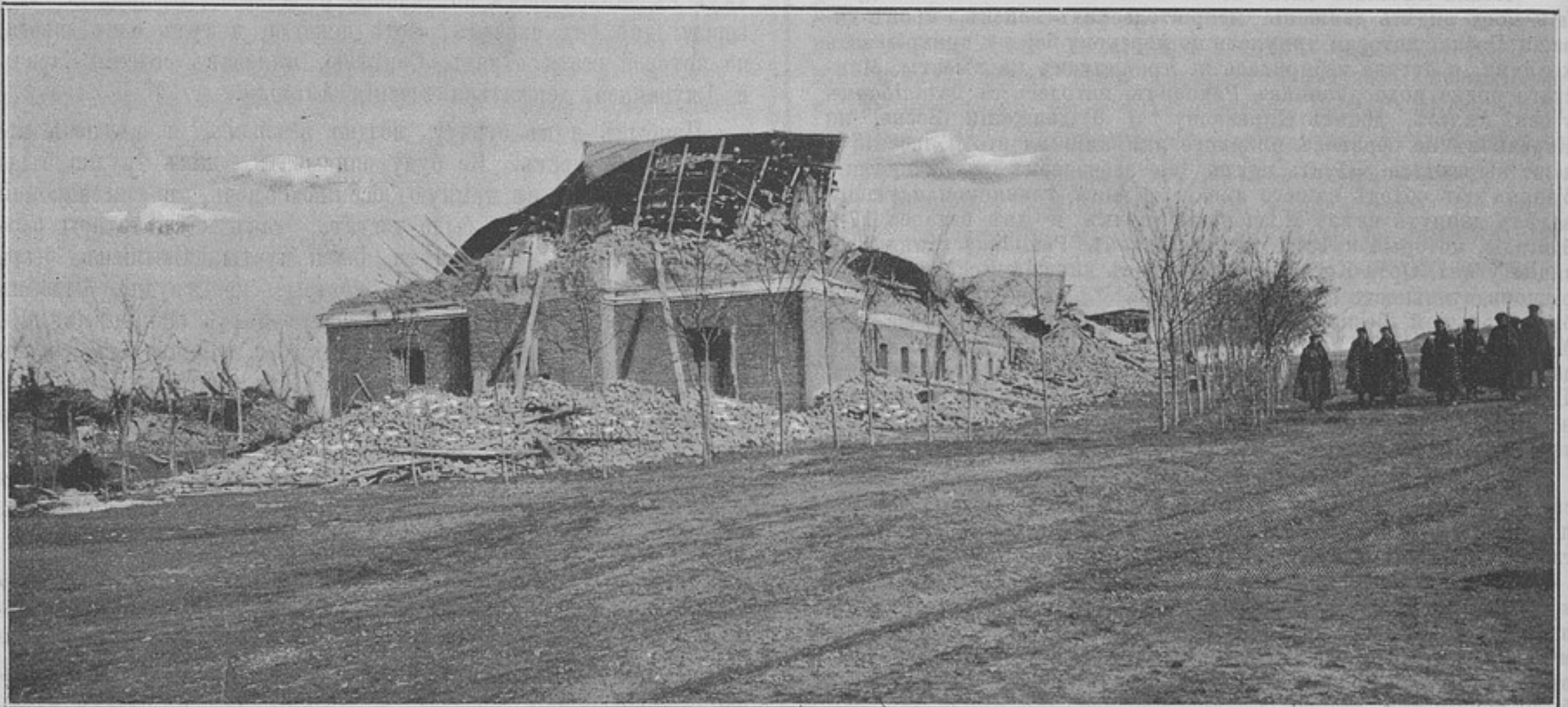
Землетрясеніе въ Андижанѣ. Казармы.

Проще, практичнѣе и красивѣе — придать ему фасонъ кавалерійской лядунки, носимой не на перевязи, ибо при скатанномъ черезъ плечо пальто было бы затруднительно доста-