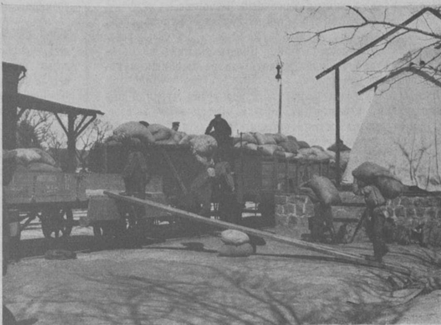
Погрузка муки въ дѣйствующей арміи..

Группа нижнихъ чиновъ встрѣчается съ подѣхавшимъ уполномоченнымъ передового отряда г. Москвы, г. К—мъ и тотчасъ же задаетъ ему все тѣ же вопросы: о походѣ, о томъ, какія войска назначены и когда пойдутъ. Всегда привѣтливый къ нижнимъ чинамъ К. безпомощно разводитъ руками.