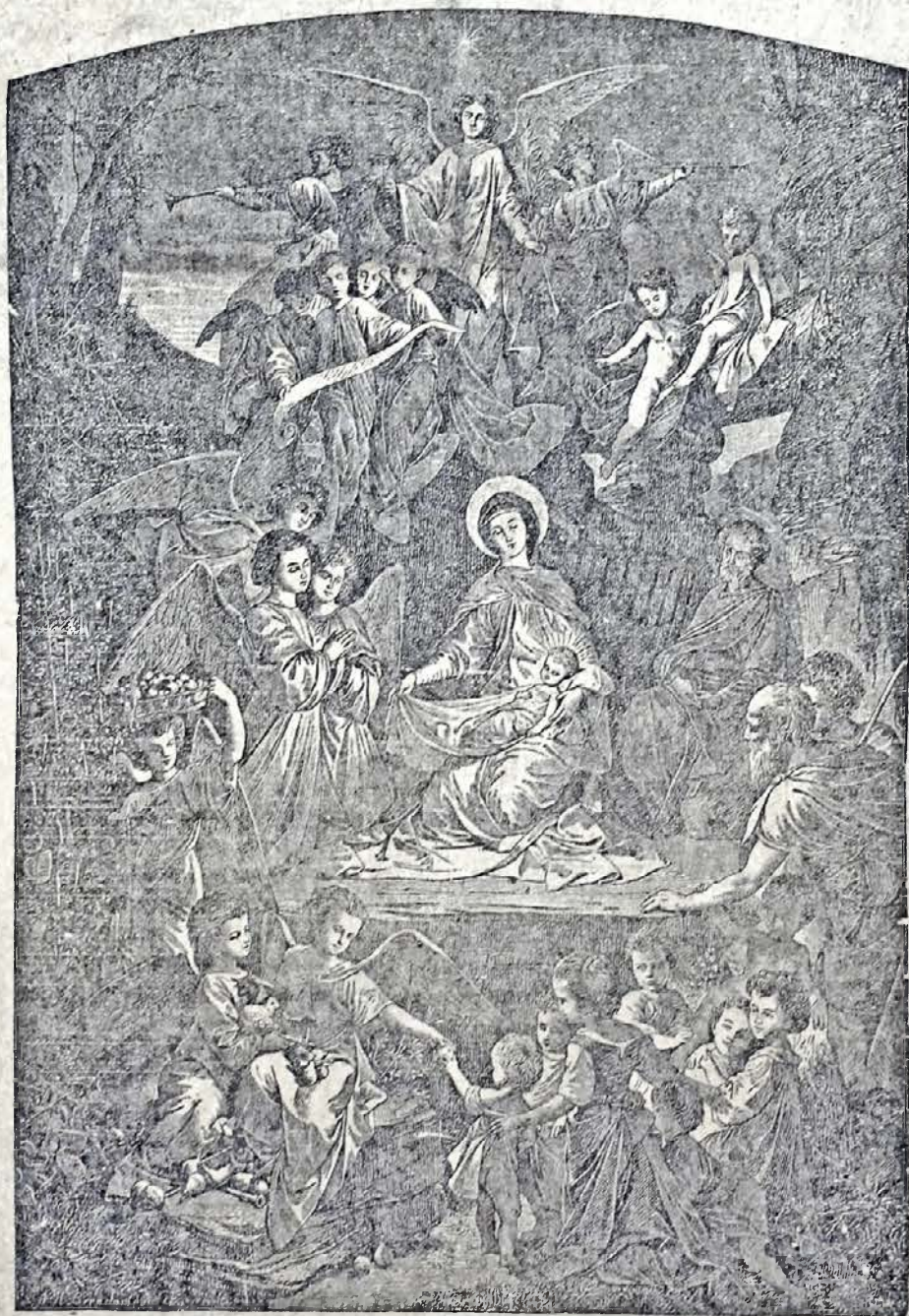
Слава въ вѣшнихъ Цѣл, ѿ на земли миръ: во человекѣхъ благоволеніе (Лук. 1, 14).

Коли „сьвята ніч“ по раз першій загостила на сей сьвіт, обходили її лише