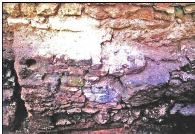
Fragmento de la Muralla Romana