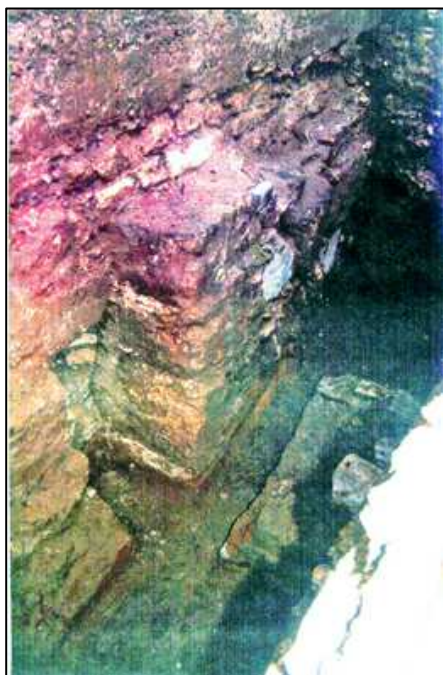
Fragmento de la Muralla Romana y apoyo de un arco del Acueducto