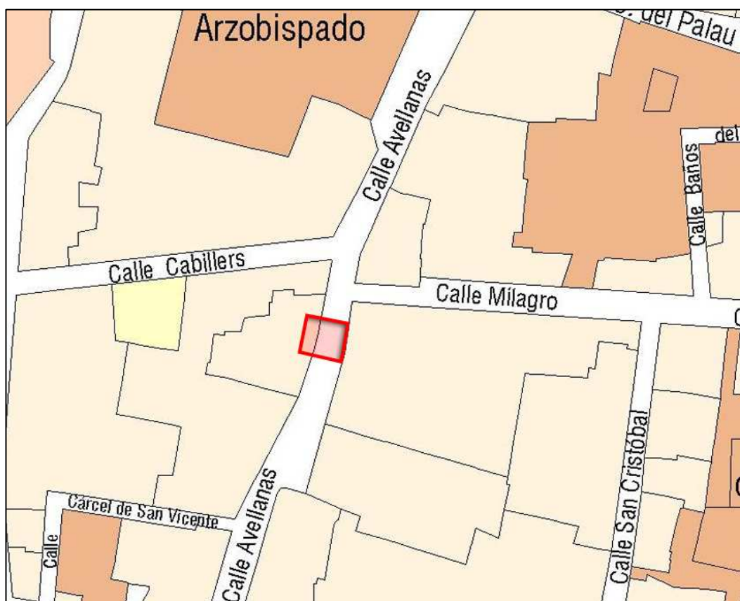
Planeamiento vigente SIGESPA con ámbito arqueológico propuesto