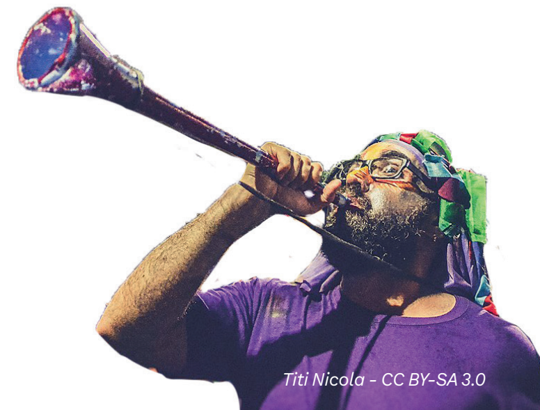
Titi Nicola - CC BY-SA 3.0