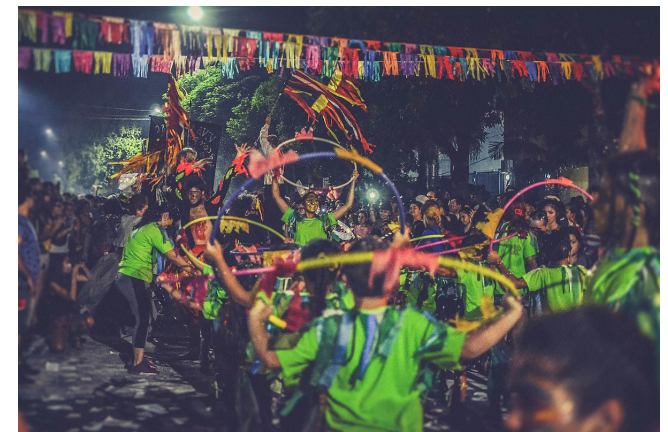
Titi Nicola - CC BY-SA 3.0

*para esta actividad es necesario contar con internet