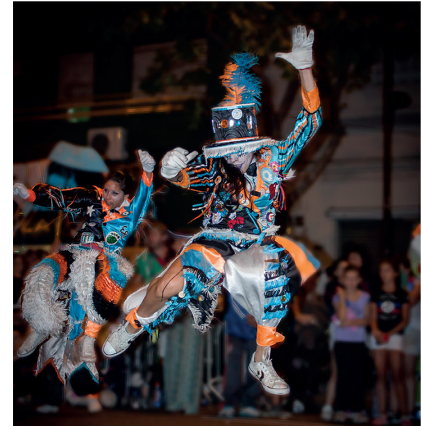
(Carnaval porteño)

Luego, sugerimos dividir al grupo en 3 o 6 subgrupos (o más, de acuerdo a la cantidad de estudiantes que haya) y asignar a cada grupo una imagen. El grupo deberá investigar sobre el carnaval que les tocó: su historia, sus tradiciones, cómo es la celebración, si cambió a lo largo del tiempo, entre otra información que consideren relevante.