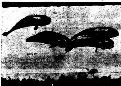
在鱈尾鱈胸或刺的面後蓋其用利妙巧能魚種這。魚樹攀心 。樹上登攀並，走上地濕

陽光強烈，因此熱帶地方的植物完全是大葉子的常青樹，沒有溫帶地方那種冬天樹葉飄落的大葉子樹。而且樹木生長極速，如橡皮樹等，六年中