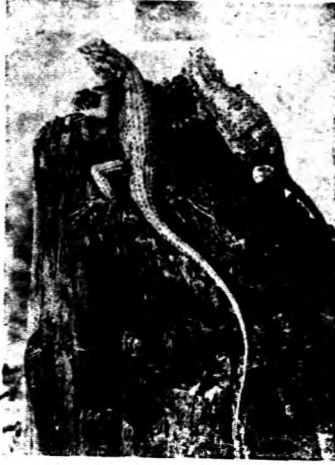
● 嘴達米一週有多長身，虎蟹的岸南 ● 小嗜者性雌方右，性雄為方左中國

觀。 灼熱的太陽照在水面上，赤道下的海水變成溫暖，東北的貿易風將此暖流吹向西方流動，這就是赤道流。北方的赤道流經菲律賓北上至台灣，在日本海面流著的所謂黑潮即構成日本海流，流來許多洄游魚。