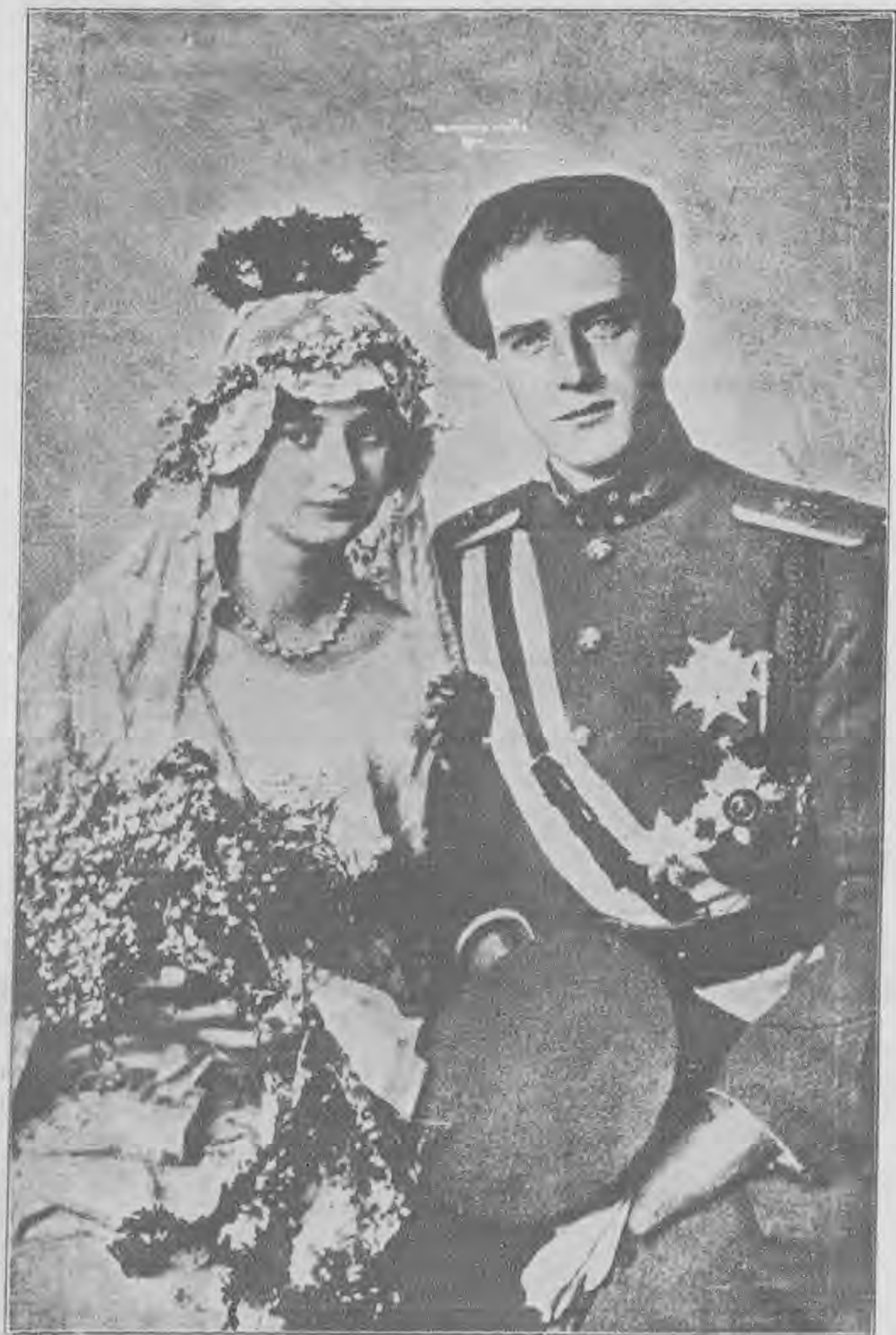
新即位之比利時國王阿博三世及王后