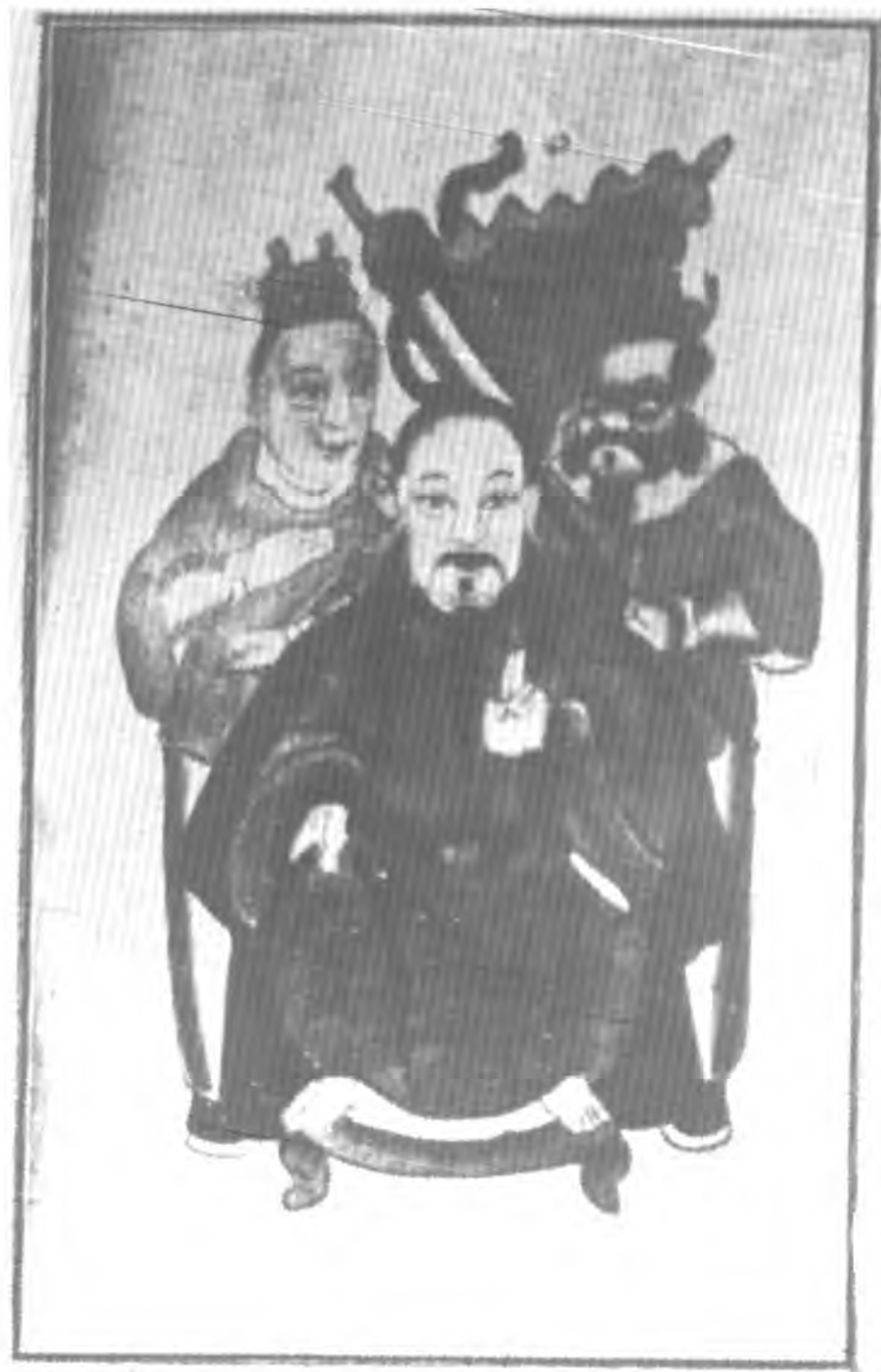
北 帝 像