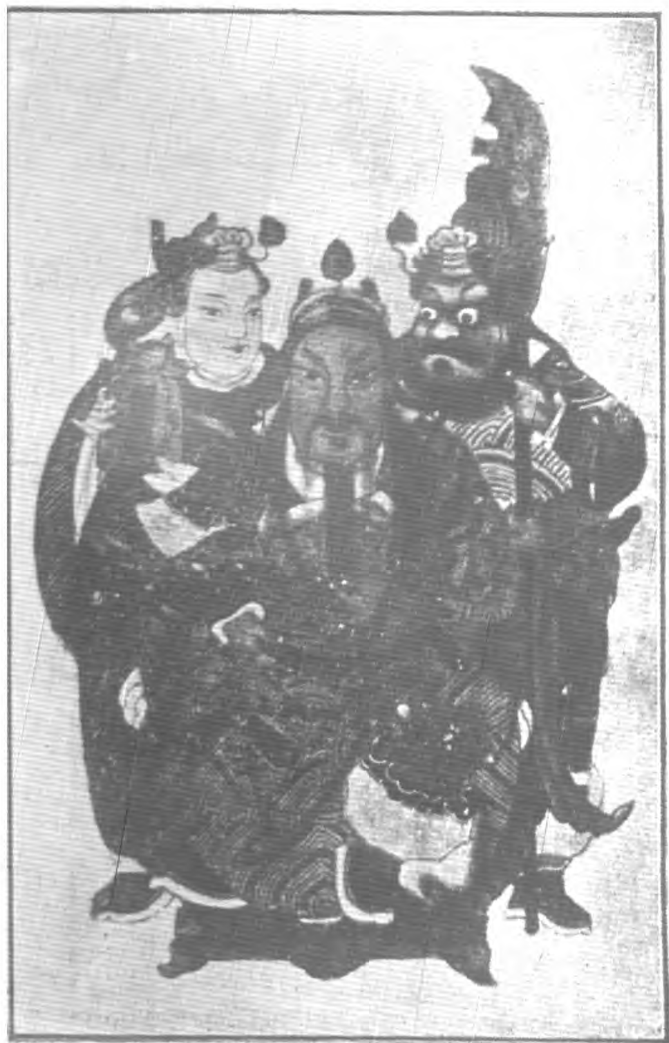
關 帝 像