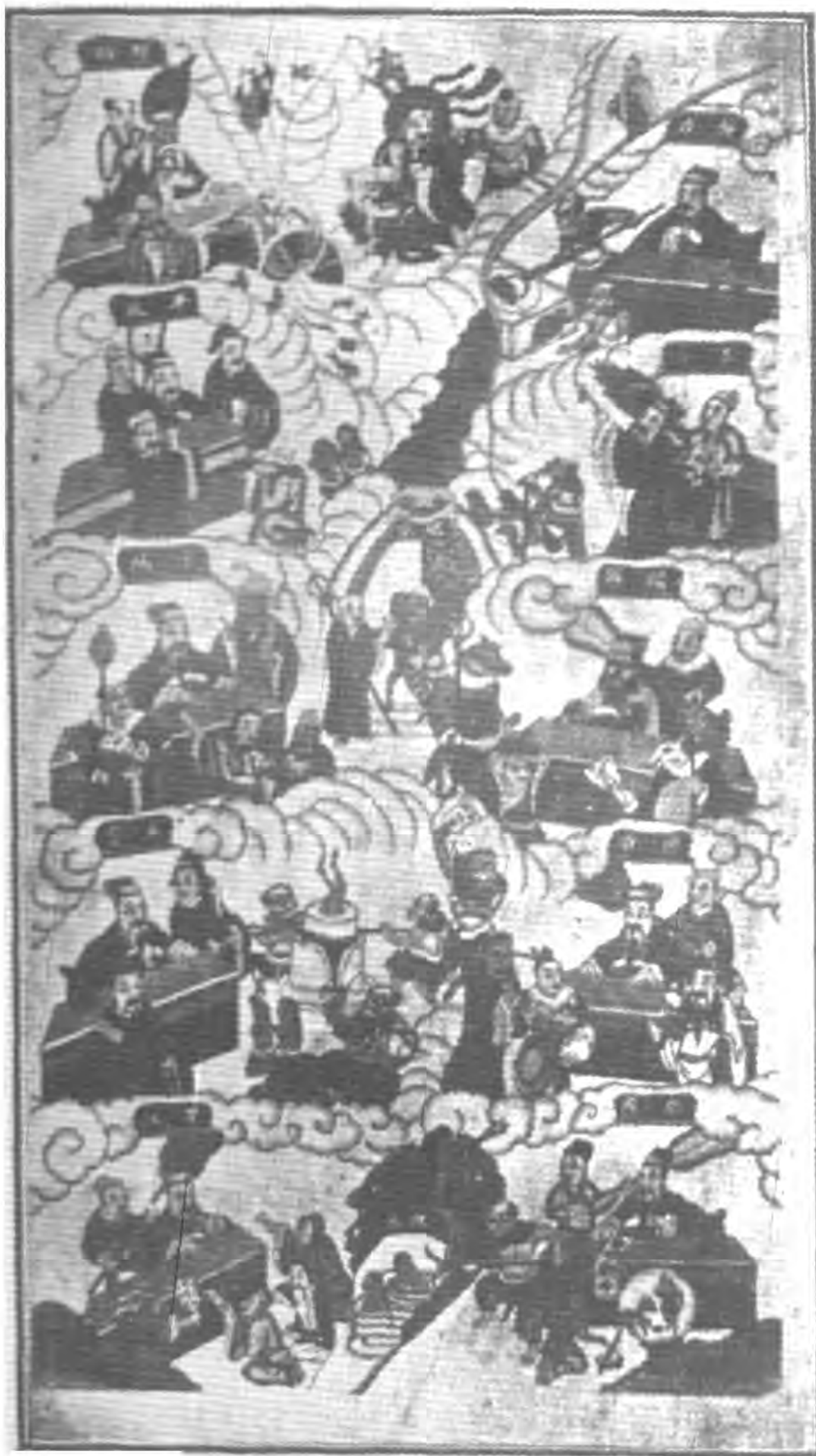
十殿閻王畫像 (本所風俗陳列室藏)