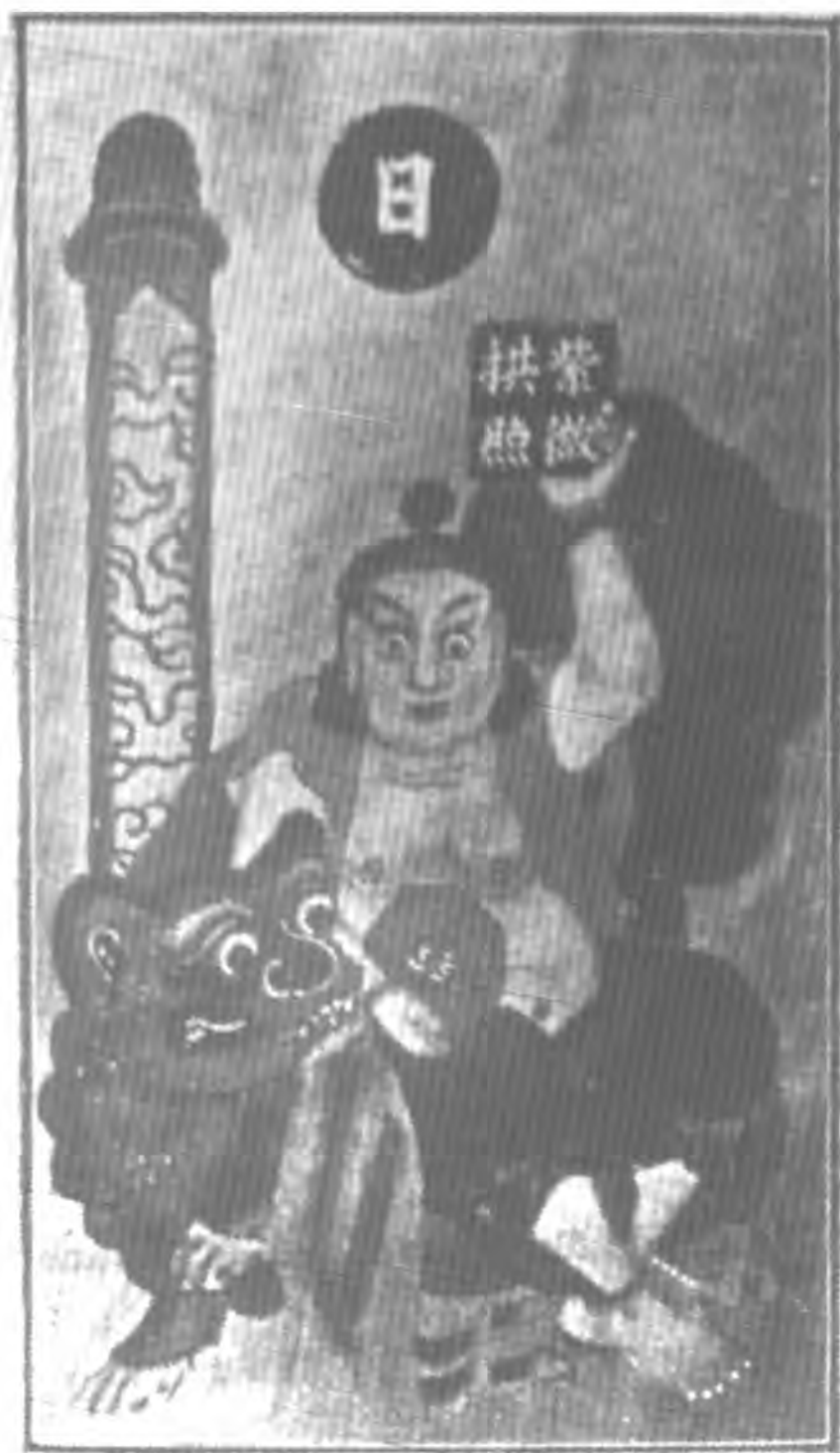
紫 微 大 帝 像