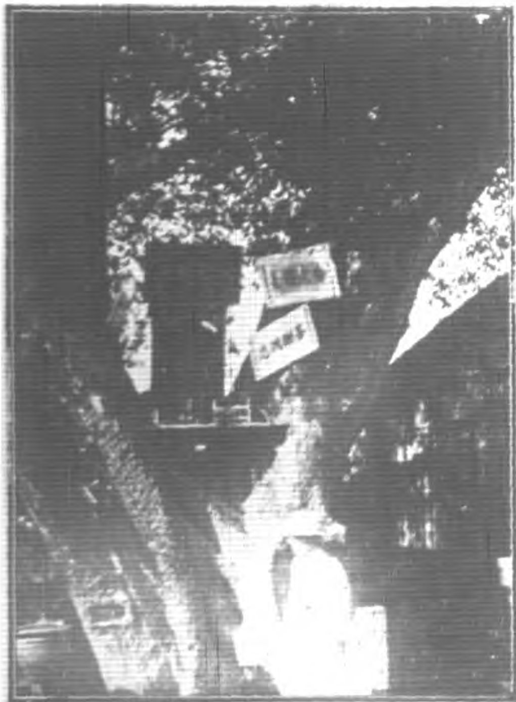
福州城外樹上的齊天大聖神龕