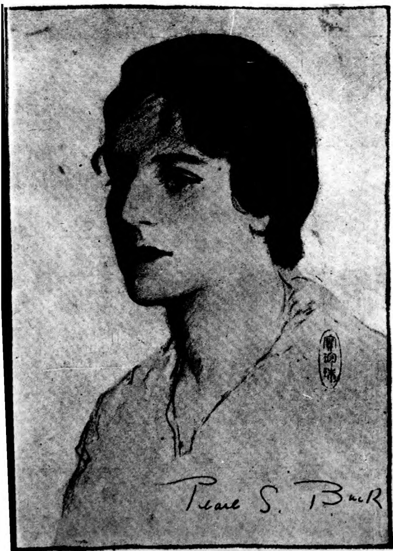
士女珠珍賽者著書本