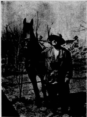
達曼軍司令郭甫久鶴