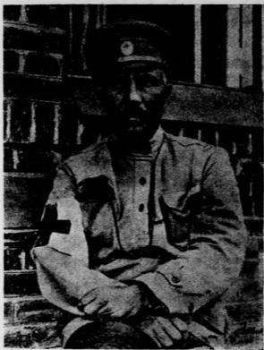
戰場上的綏拉非摩維支