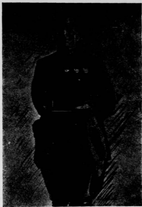
葉必凡·岳維支·郭甫久鶴