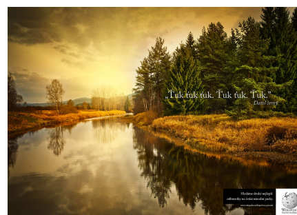
Kdopak jsou největší experti na chráněná území u nás? A kde je máme hledat?

První expert, který se představil jako prase divoké ( Sus scrofa ), se dal do psaní článku s chutí a vervou. Bylo na něm vidět, že přidává na Wikipedii své životní zkušenosti. Za chvíli byl vystřídán svým potomkem. Ten plný vědomostí získaných na nižším stupni vzdělání doplnil drobnosti a přidal společnou fotografii, na které zvětšil svého rodiče během psaní. Celá prasečí rodinka měla možnost zapojit se do tvorby Wikipedie, jelikož ta je otevřená všem věkovým skupinám a může ji editovat naprosto každý. Společnou prací tak vytvořili velice povedený článek o Národním parku Šumava dostupný na adrese wikipedie.cz/Experti-na-prirodu [1] , který zajisté další čtenáři ocení. Schválně se podívejte, jestli byste nechtěli něco po nich doplnit!