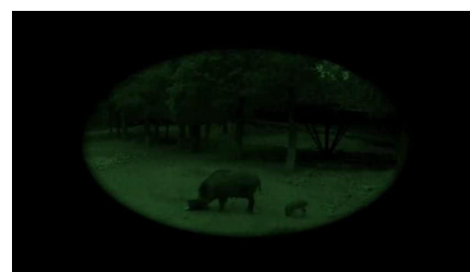
Podívejte se, jak divoká prasata píše článek pro českou Wikipedii! (Odkaz na video http://www.youtube.com/watch?v=JXNC5zXMH28 a nebo na Youtube zadejte Expertí na přírodu )