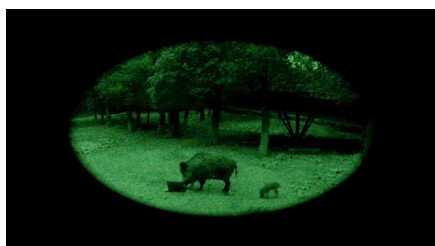
Expert na přírodu opravující zrovna heslo o národním parku Šumava

Aha, že není rozumět tomu, co rodinka napsala? Tak to je pro všechny lidské čtenáře stejné. Podobné problémy byly i s příspěvkem od dalších dvou editorů, datla černého ( Dryocopus martius ) a lišky obecné ( Vulpes vulpes ). Jak se ukazuje, zvířecí experti mají sice chuť se do psaní Wikipedie aktivně zapojit, ale s výsledky jejich práce mají lidé problémy. Jejich jazyk je pro nás k nepochopení. A proto potřebujeme při psaní Wikipedie pomoci od druhých nejlepších expertů, tedy od vás, čtenářů Wikipedie! Až příště otevřete stránku na české Wikipedii, nebojte se stisknout tlačítko editovat a přidat pár informací, které o daném tématu víte. Není to nic těžkého a jak je vidět, zvládl to