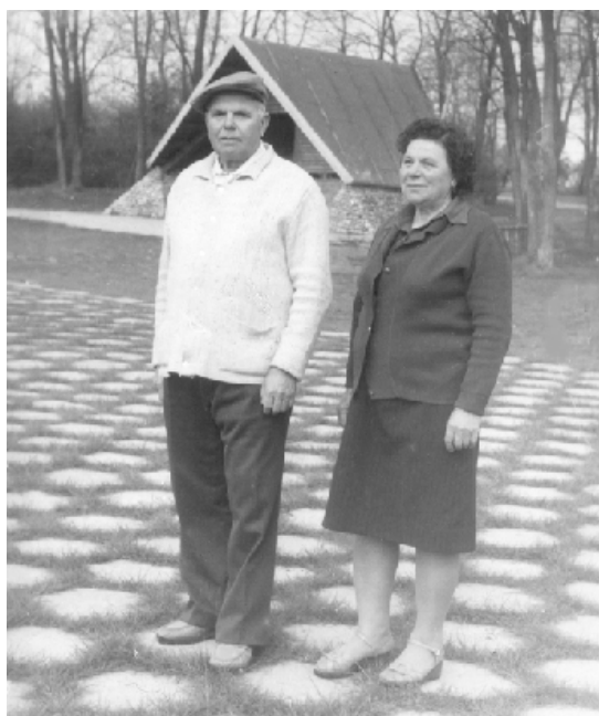
На почивка в Баня