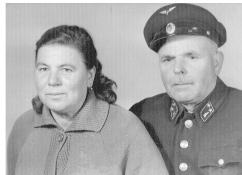
Като служител на БДЖ