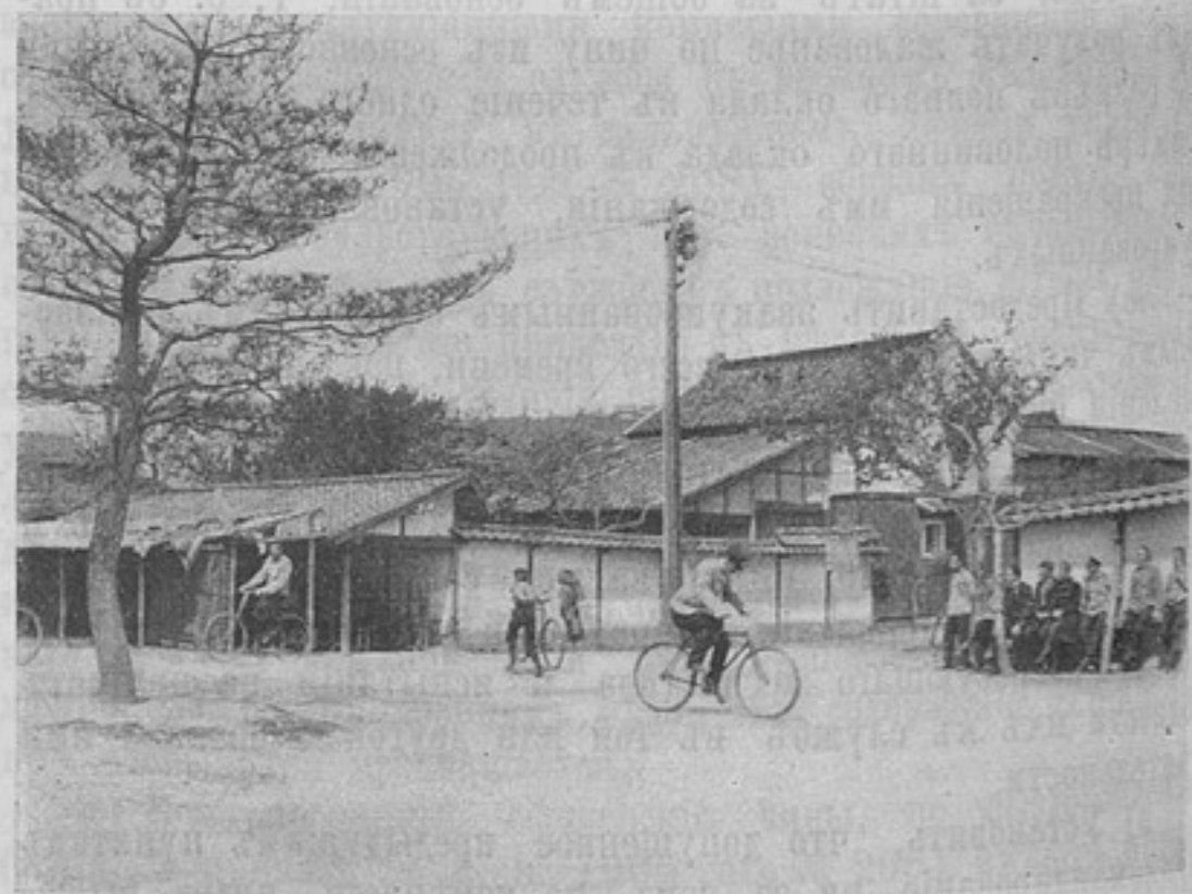
Изъ жизни русскихъ плѣнныхъ въ Японіи. Одинъ изъ видовъ спорта въ плѣну въ г. Мацуямѣ.

Нужно ли говорить, что, составляя одно цѣлое съ кавалеріей такая конная артиллерія не знала разлада между тѣмъ, что отъ нея требовали и тѣмъ, что она давала. Въ 1794 году учреждены отдѣльныя конныя роты, которыми