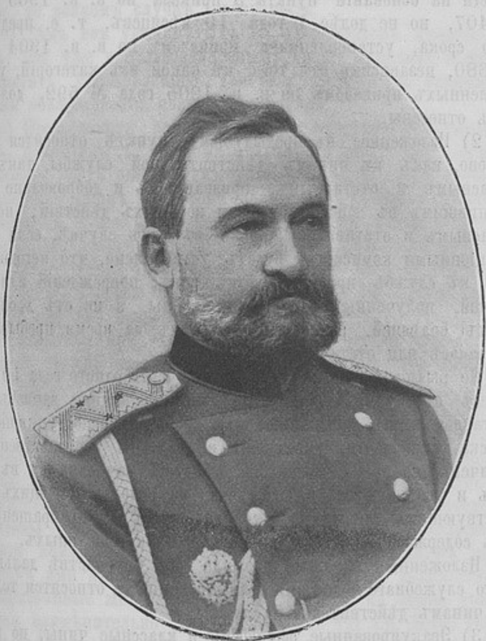
Начальникъ Варшавскаго укрѣпленнаго района, генеральнаго штаба генералъ-лейтенантъ