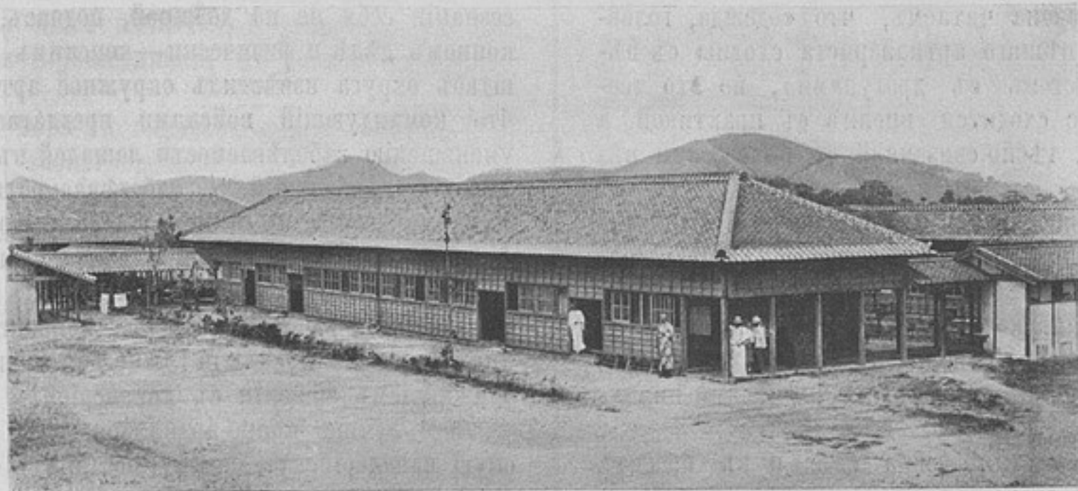
Изъ жизни русскихъ плѣнныхъ въ Японіи. Видъ барановъ въ Мацуямѣ, общежитія въ пл. офицеровъ «Огури».

Всякая склонность считать важными требованія, предъявляемые конной артиллеріи конницей, принимаются чуть ли не какъ преступныя сепаративныя вождедѣнія и энергично преслѣдуются въ мелочахъ. На нѣкоторыхъ мелочахъ въ виду