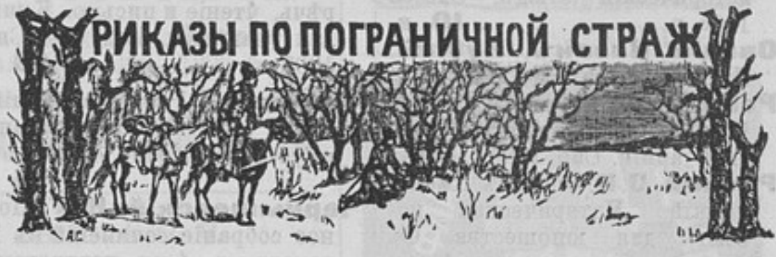
Мая 26-го дня, въ Петергофѣ.