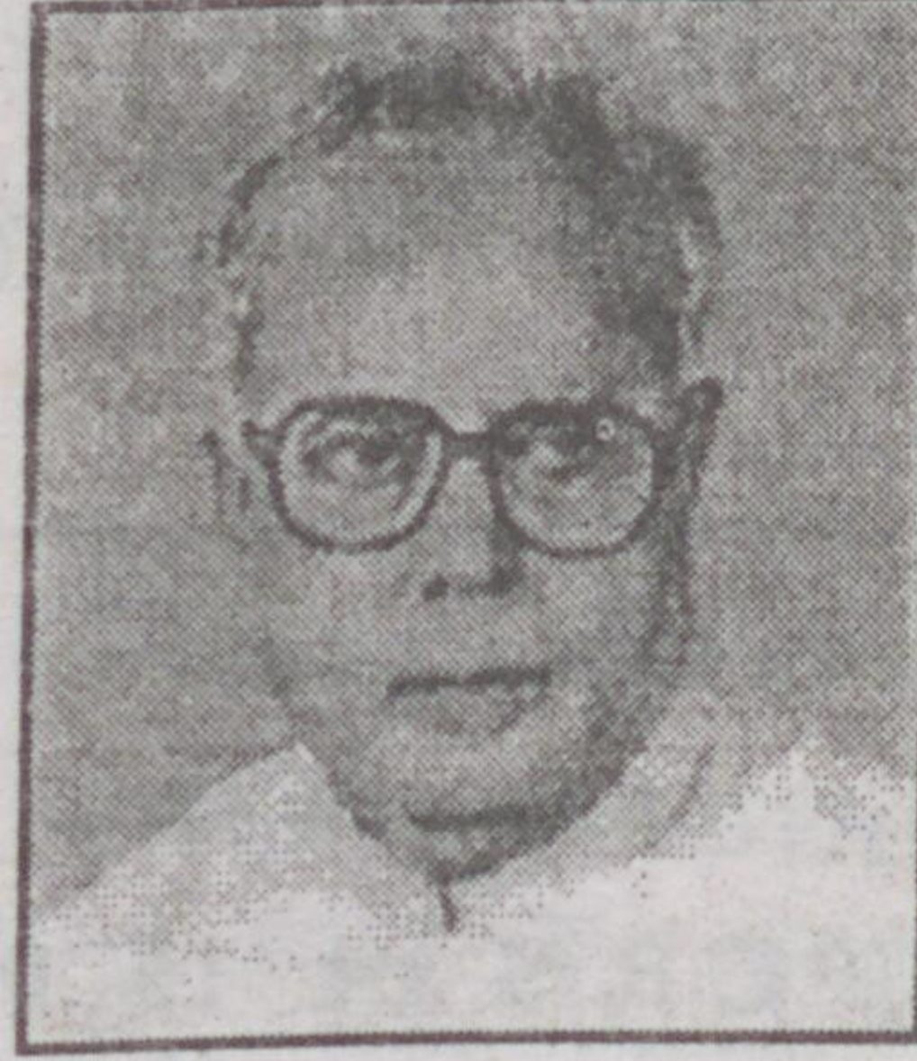
শ্রী প্রণব মুখার্জী মাননীয় কেন্দ্রীয় প্রতিরক্ষা মন্ত্রী অনুষ্ঠানের সভাপতি হবেন