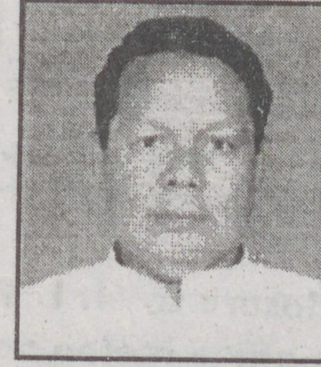
শ্রী প্রিয়রঞ্জন দাশমুকী মাননীয় কেন্দ্রীয় তথ্য ও সম্প্রচার এবং সংসদীয় বিষয়ক মন্ত্রী সম্মানিত অতিথি হবেন