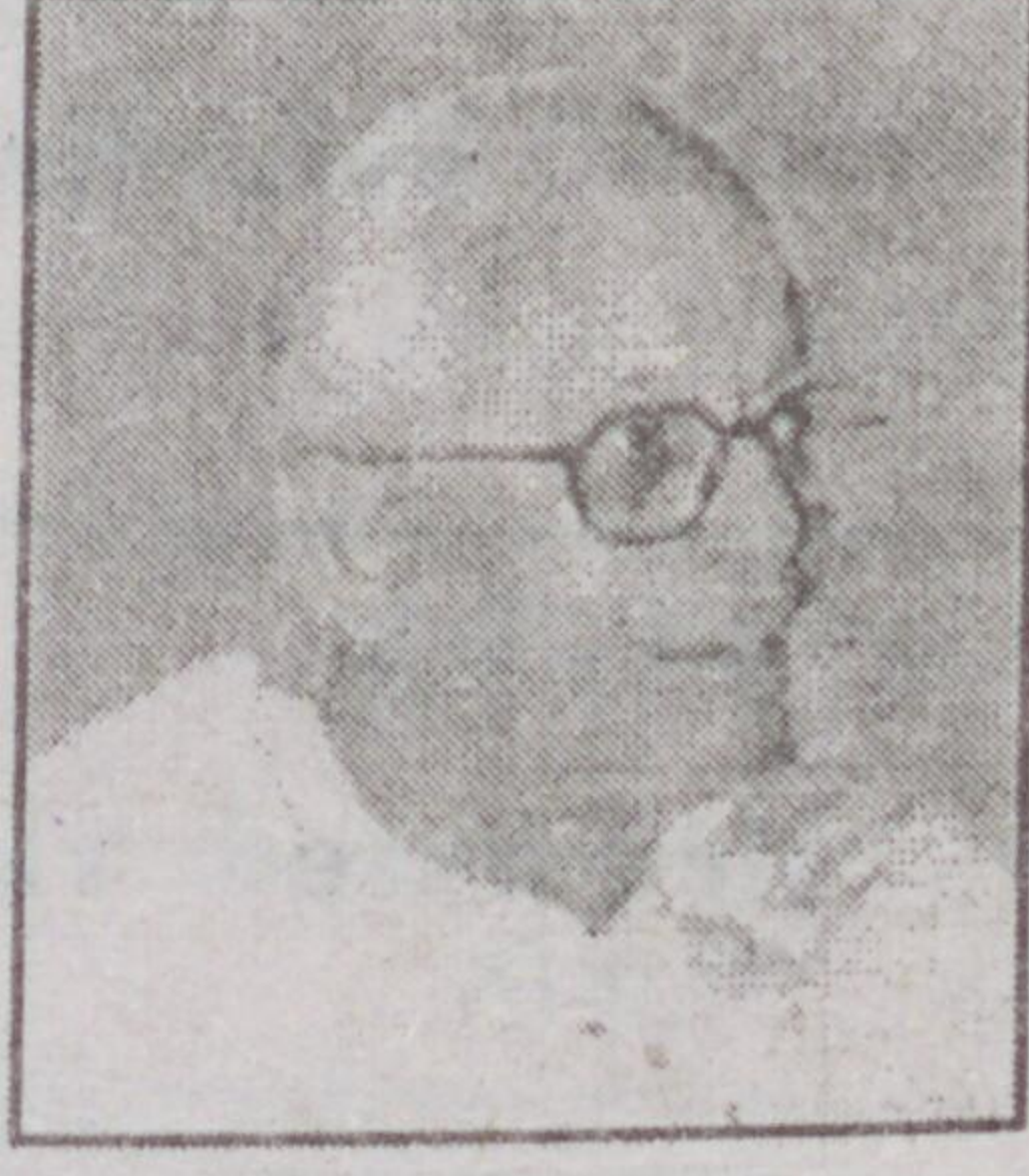
শ্রী বুদ্ধদেব ভট্টাচার্য পশ্চিমবঙ্গের মাননীয় মুখ্যমন্ত্রী প্রধান অতিথি হবেন