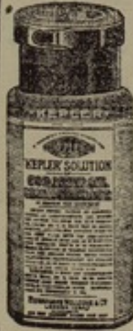
شكل مصر جدا

محلول ، كپلار ، يحسن مزجه بالارز واللبن وكثير من الوان الطعام فيصيرها لذينة الطعم مفذية منعمشه يمكن الحصول على محلول ، كپلار ، من جميع الاجزائات الكولاه اسطيفان لنج وشركاه .