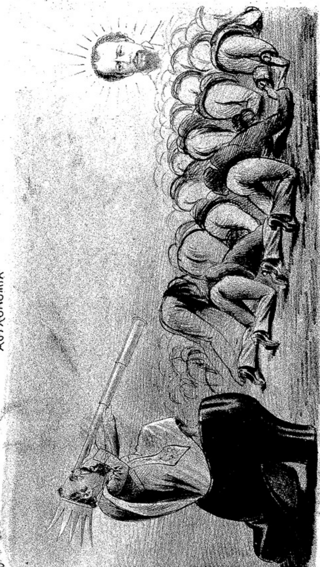
Señor ponente, Luna llena y sol levantado.