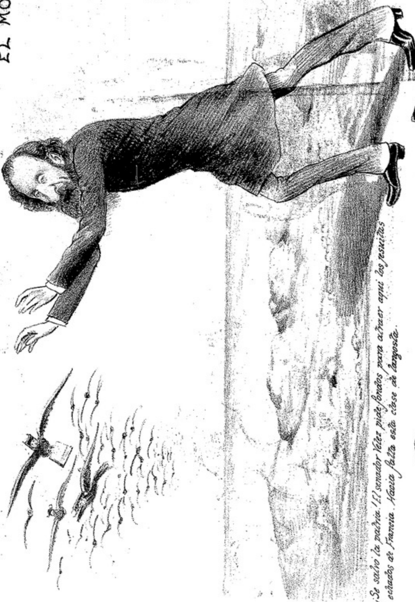
¡Se salva la patria! El senador véter pide fondos para atraer aquí las pesqueras estradas de Francia. Ahora falta sólo cose de langosta.