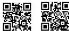
Códigos QR de Google Play Store y Apple Store respectivamente.

La revista El Farmacéutico tiene a disposición de los lectores su aplicación gratuita para móviles y tabletas. La aplicación está disponible en las plataformas Google Play Store, donde se puede descargar la versión para móviles y tabletas Android, y en Apple Store, donde los lectores pueden encontrar la versión para dispositivos iPhone e iPad. Ambas plataformas aportan a los lectores un acceso inmediato y cómodo a todos los contenidos de cada revista, a los contenidos exclusivos de su versión on-line y también permiten acceder directamente a sus páginas en Facebook y Twitter, al tiempo que facilitan la participación. 7