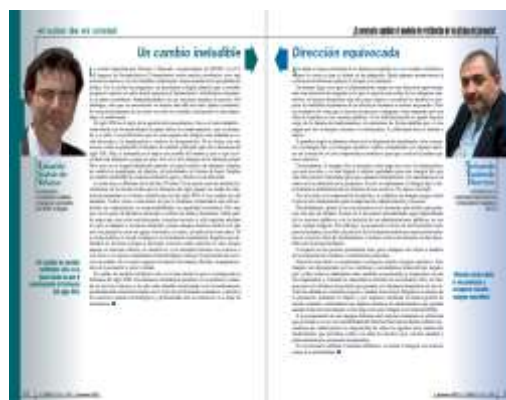
Ejemplo de El color de mi cristal El Farmacéutico, nº 482