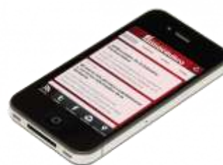
iPhone con la aplicación instalada y visible en la pantalla