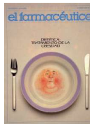
Portada de ejemplar antiguo Titular: Dietética. Tratamiento de la obesidad

A partir de aquí, la revista ha tenido el privilegio de seguir muy de cerca los acontecimientos que han marcado esta etapa de la profesión durante los años noventa y la primera década del 2000. El Farmacéutico ha informado de cómo se hacían efectivas las transferencias sanitarias y de cómo cada comunidad autónoma dictaba sus propias leyes. También ha vivido una huelga japonesa, varias huelgas generales, ha sufrido varios PROSERME (Programa de Selección y Revisión de Medicamentos), ha dado a conocer lo que es la financiación selectiva de medicamentos y “medicamentazo”, y ha descubierto junto a sus lectores que las farmacias podían abrir las 24 horas los 365 días del año y la competencia de las parafarmacias, muchas de ellas situadas en las grandes superficies comerciales. Del mismo modo ha cubierto la evolución de términos surgidos en esta etapa que parecen haber existido siempre: ‘genéricos’, ‘precios de referencia’, ‘atención farmacéutica’ o, más recientemente, ‘merchandising’ y ‘receta electrónica’. 3