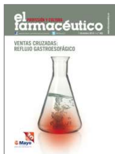
Portada del número 482

2. Titular: Referente al tema al que se le dedica más páginas. Consta de una frase escrita, con tipografía de palo seco y en caja alta (mayúsculas), que carece de verbo. El color de las letras se escoge por criterio de contraste con el color de fondo.