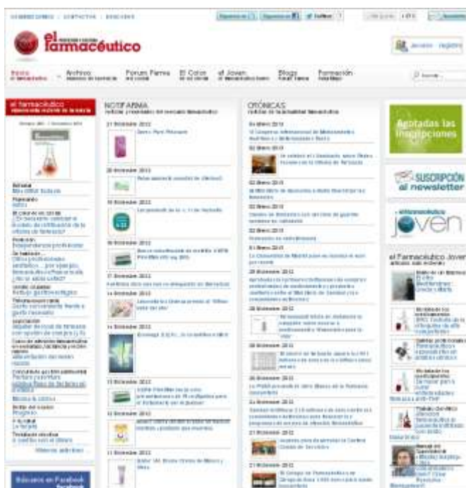
Captura de pantalla de la interfaz de la página web

En lo referente a la estructura, la página web se ordena esencialmente en las siguientes secciones: en primer lugar, en la parte superior de la interfaz, se encuentra la cabecera con el logotipo y nombre de la publicación, además del directorio general de la página que cuenta con las pestañas: Inicio, Archivo, Forum Farma, El color de mi cristal, El Farmacéutico Joven, Blogs y Formación. En segundo lugar, encontramos el corpus de la web dividido en cuatro columnas bien diferenciadas: El Farmacéutico (con acceso directo al número más reciente de la revista), Notifarma (un escaparate vivo y activo de los nuevos productos