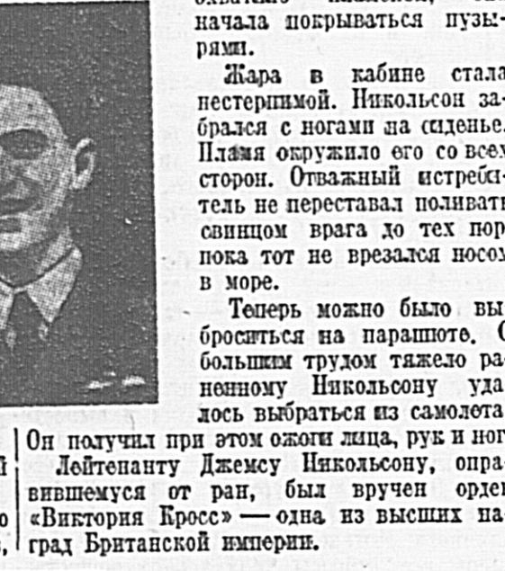
Лейтенант Джеймс Никольсон, опрашиваемый о раи, был вручен орден «Виктория Крест».

В машину 23-летнего лейтенанта истребительной авиации Джеймса Никольсона попали четыре снаряда.