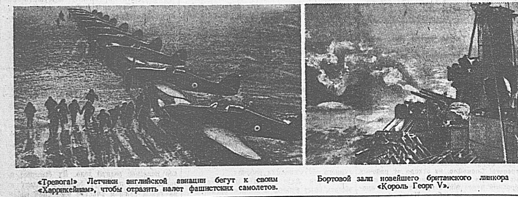
«Трогга» Летчики английской авиации бегут к своим «Харрикейнам»...

Горючий зал новейшего британского линкора «Король Георг V».