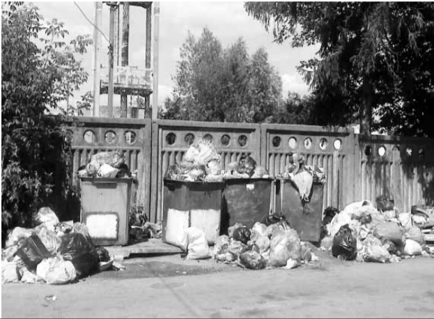
Макарів 2012 рік