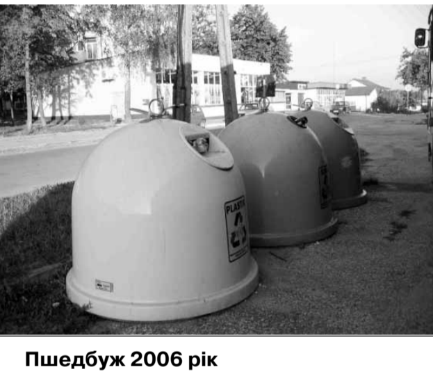
Пшедбуж 2006 рік

Хотілося б щоб наш Макарів був європейським містечком, прикладом для наслідування в підтримці чистоти та новітньої. Наприклад у місті Пшедбуж (Польща) ще в 2006 році було запроваджено сортувальну систему для побутових відходів. Це містечко за чисельністю мешканців таке ж як Макарів. Проте нам до їх досвіду ще далеко. Наші пункти викидання сміття обладнані подекуди старими поржавілими баками, які постійно переповнені.