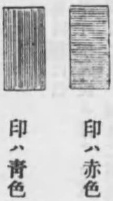
地 白 色