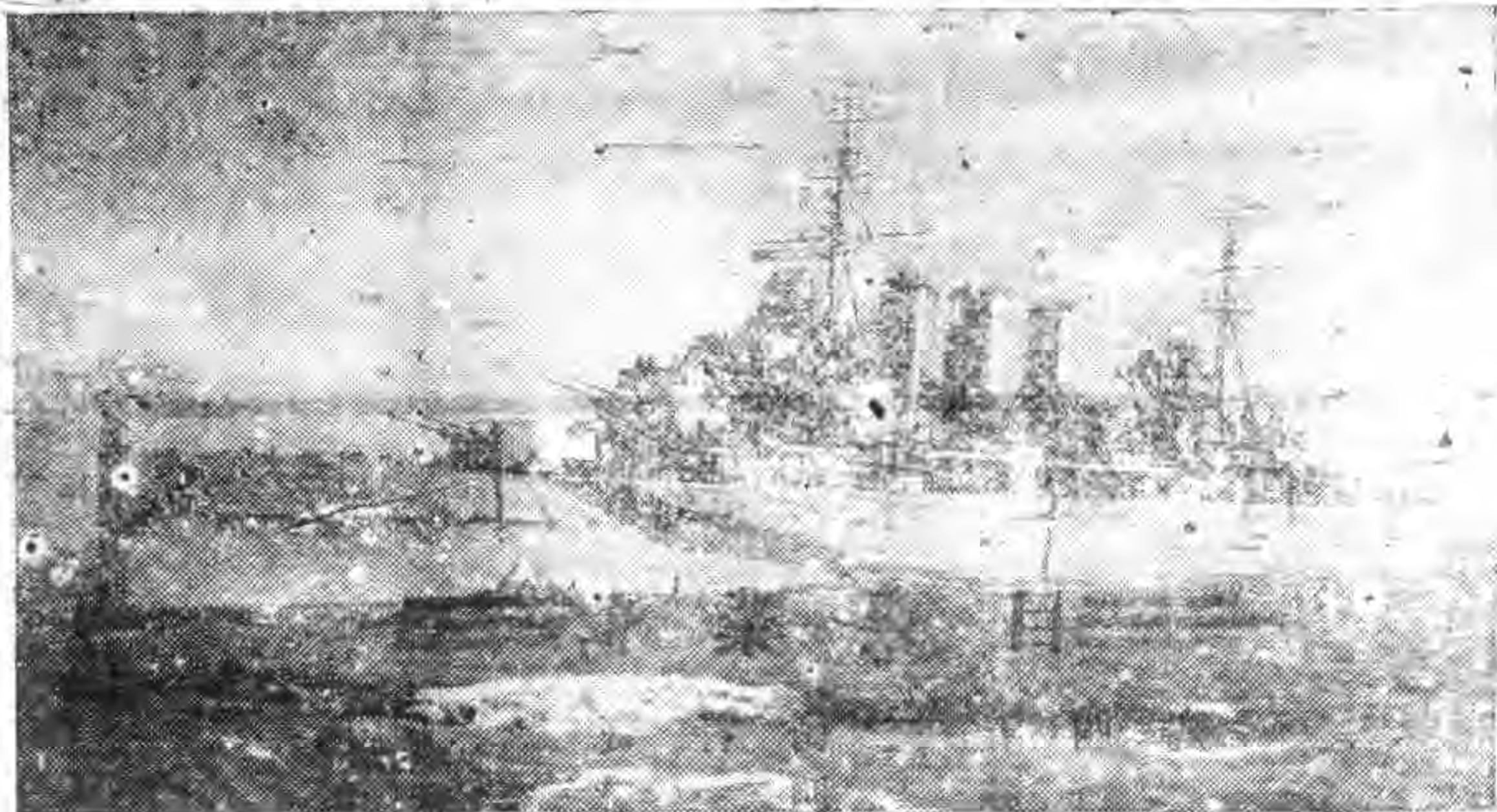
个 盟方驅逐艇護送軍隊運 赴前線作戰時的照像。