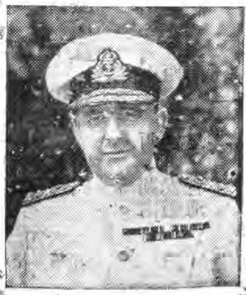
个 英地中海艇隊總司令哈伍德氏。