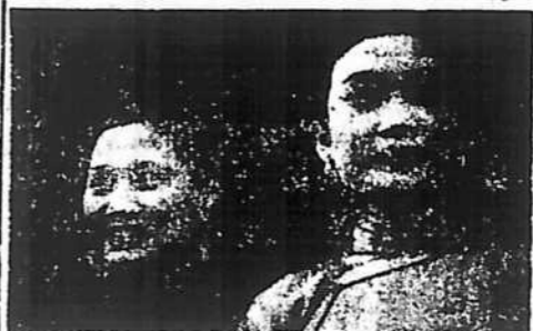
參加螺來飯店揭幕之彭星 胡蝶與徐來