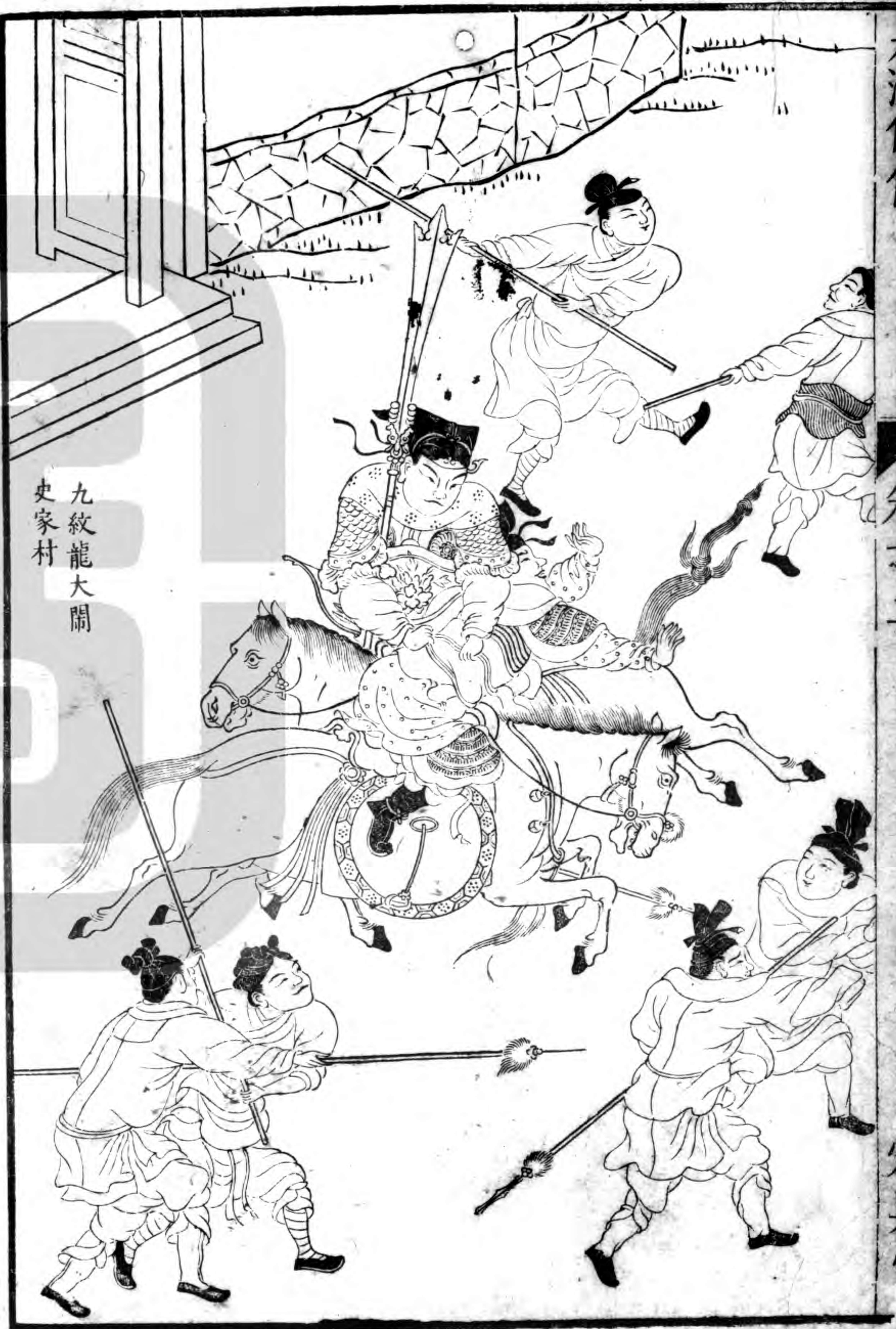
九紋龍大鬧 史家村