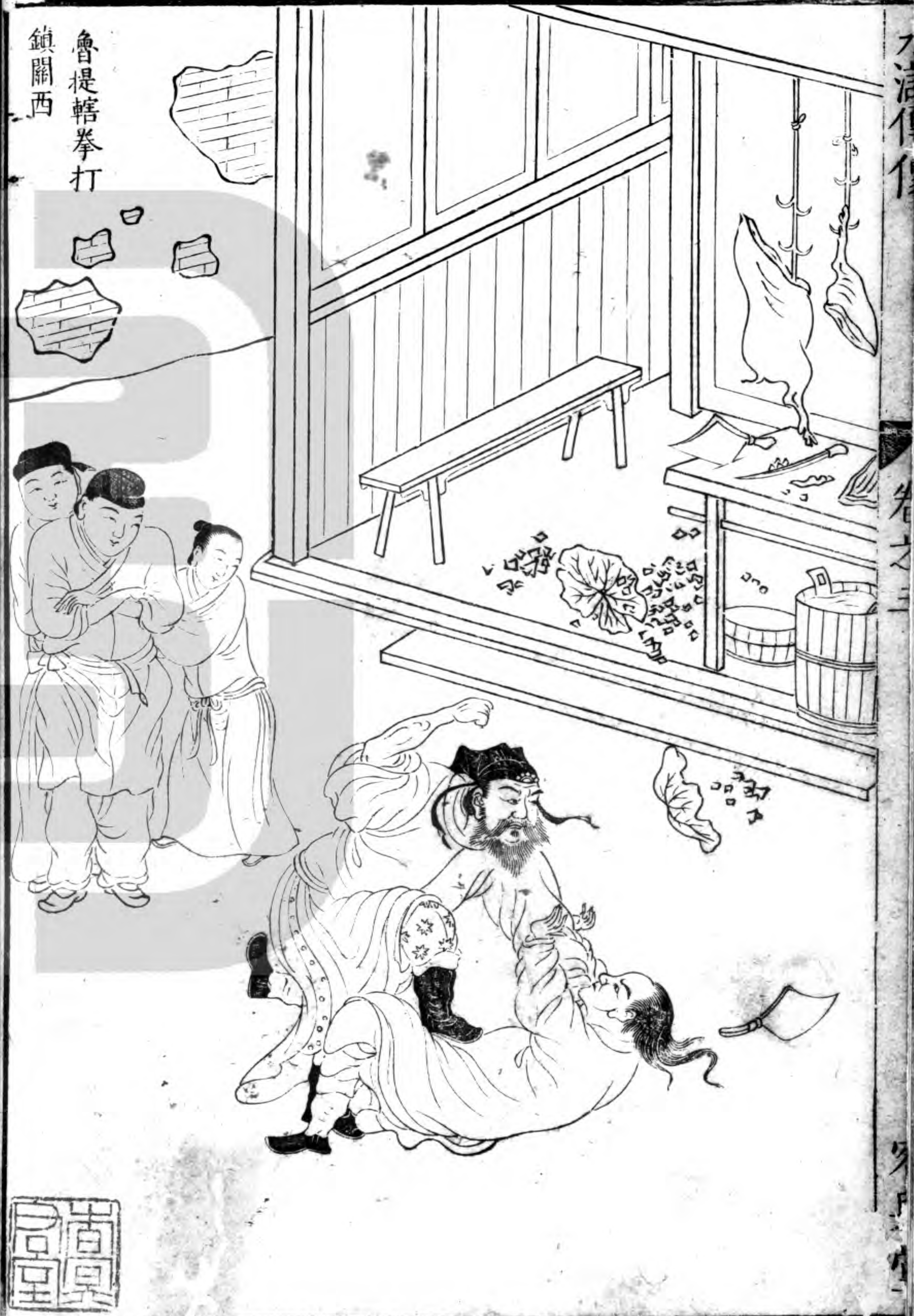
魯提轄拳打 鎮關西