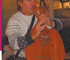
Бандурист, композитор, наш земляк Василь ЛЮТИЙ