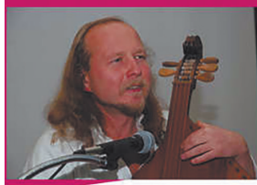
Кобзар, заслужений артист України Тарас СИЛЕНКО