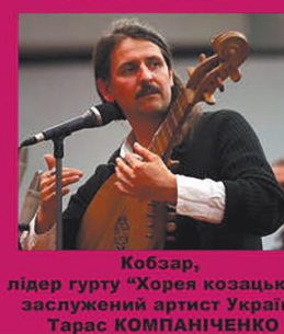
Кобзар, лідер гурту "Хоря козацька", заслужений артист України Тарас СИЛЕНКО