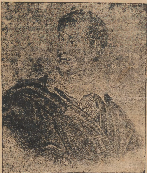
GEORGE GORDON NOEL, LORD BYRON (1788 — 1834).