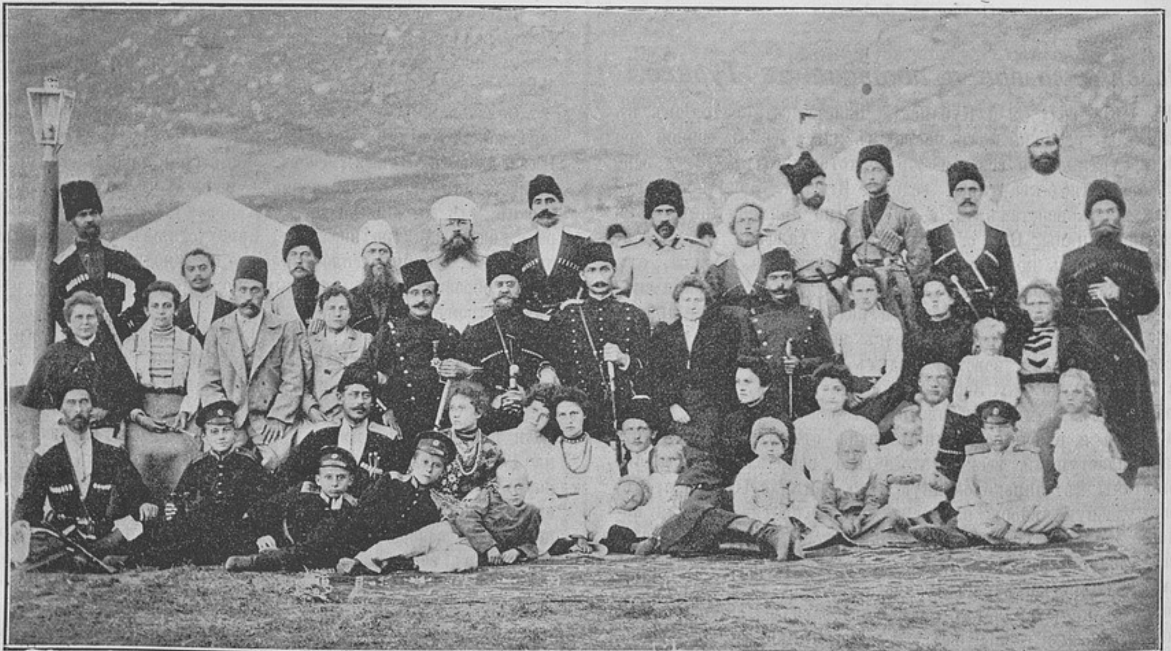
Турецкіе офицеры въ гостяхъ у русскихъ (къ статьѣ «Зорскій лагерь и поѣздка въ Турцію»).

На пластунахъ, случайно открывшихъ эти заброшенныя, дорогія могила, на рубежѣ двухъ дружественныхъ нынѣ государствъ, лежитъ святой долгъ напомнить о славномъ боѣ 17-го іюля 1854 года и вызвать части войскъ, участвовав-