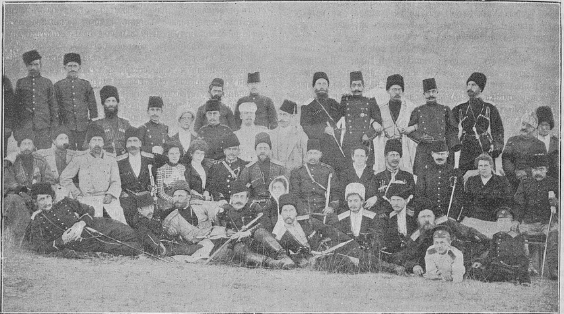
Русскіе офицеры въ гостяхъ у турецкихъ (къ статьѣ «Зорскій лагерь и поѣздка въ Турцію»).

безвѣстныхъ героевъ, павшихъ славною и завидною смертью въ 1854 году при взятіи Чингильскихъ высотъ. Могила эти состоятъ изъ нѣсколькихъ рядовъ провалившихся ямъ, наполненныхъ камнями, а одна, повидимому офицерская, обложена