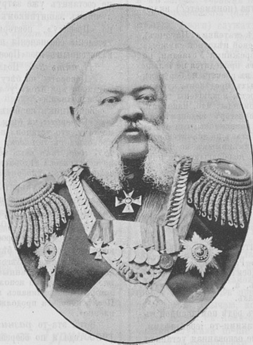
Директоръ Оренбургскаго Неплюевскаго кадетскаго корпуса, почетный членъ Совѣта Оренбургскаго Института Императора Николая I, почетный казакъ Оренбургской станицы Оренбургскаго казачьяго войска, Генералъ-лейтенантъ

«За послѣднее время въ «Развѣдчикѣ» былъ помѣщенъ рядъ статей по поводу нашего новаго «Устава строевой пѣхотной службы» изданія 1900 года, въ которыхъ авторы, видимо, люди недостаточно усвоившіе себѣ духъ новаго Устава, толкуютъ его вкривъ и вкосъ, безъ соответствующихъ основаній, придираются къ мелочамъ, не имѣющимъ значенія, и вообще замѣтками своими вселяютъ, въ малоопытныхъ въ уставномъ дѣлѣ людяхъ, полное недоверіе къ этому официальному руководству. Почти всѣ сдѣланныя замѣчанія, по ближайшемъ ихъ раз-