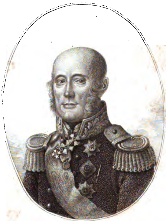
Князь Михаилъ Богдановичъ Барклаиде Толли.