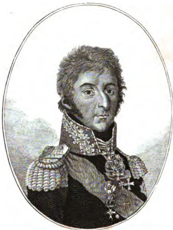
Князь Петръ Ивановичъ БАГРАТИОНЪ.