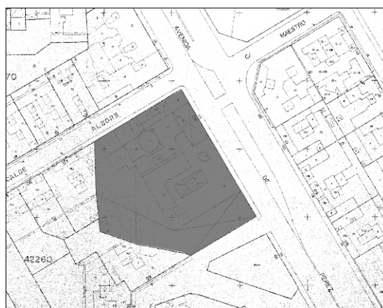
Cartográfico C.G.C.C.T 1980