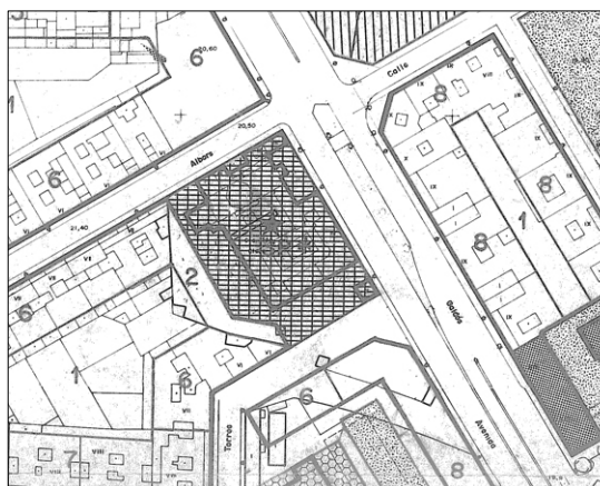
Plan general 1988