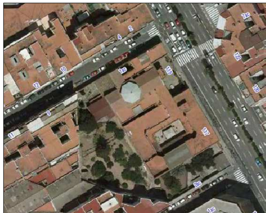
Fotografía Aérea 2008