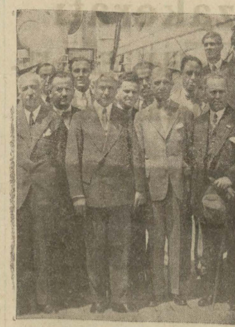
Hamdullah Suphi B. ve teşyi edenler

Yeni Bükreş Sefirimiz Hamdullah Suphi B. dün sabah Prenses-Mari vapurile ve Köstence tariki mahalli memuriyetine gitmiştir.