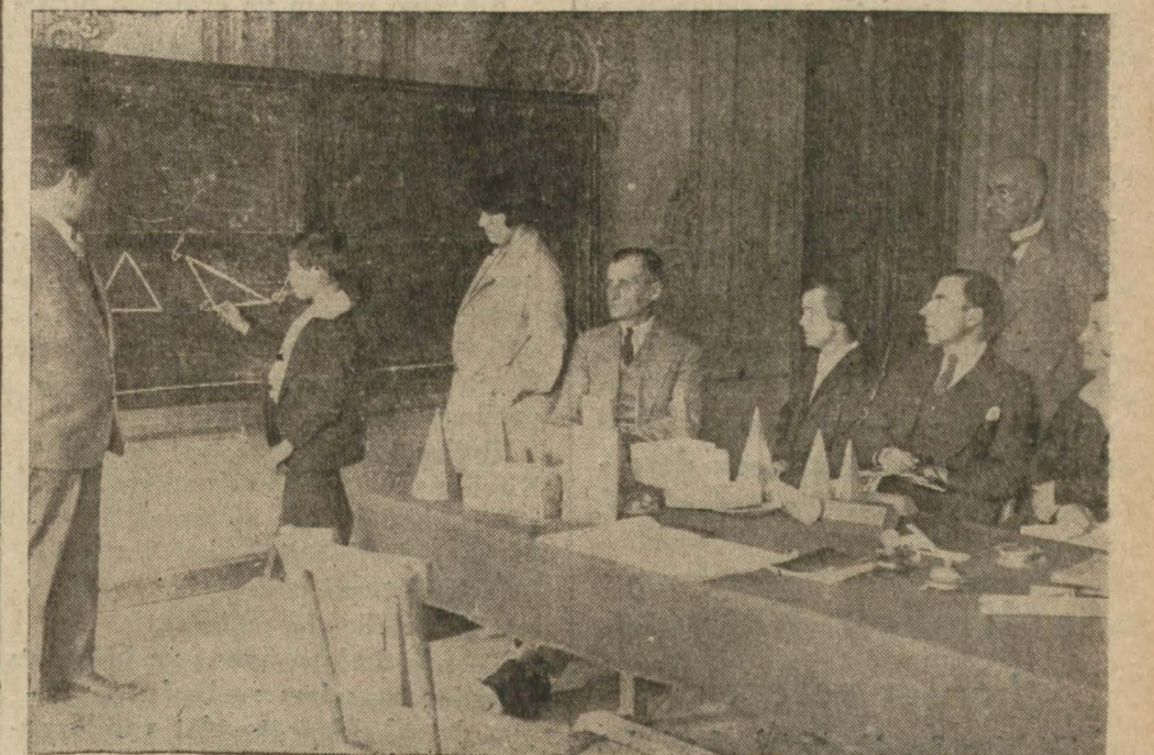
Bir ilk mektepte, son sınıf talebesinin imtihanı yapılırken...

Lise ve orta mekteplerde son kuraat imtihanlarına başlanmıştır. Yedi haziranda kanaat notları ikmal ve mektepler tatil edilecektir. Lise ve orta mektep son sınıf talebelerinin mezuniyet imtihanlarına da 15 haziranda başlanarak ayın sonunda ikmal olunacaktır. Temmuzda tale-