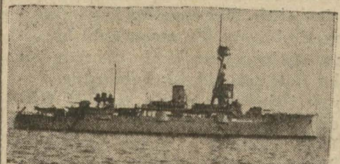
Şehrimize gelecek Danimarka kruvazörü

Danimarka'nın Vieses Juel kruvazörü üç dört güne kadar şahrimize gelecektir. Kruvazörün gelmesi münasebetle Danimarka sefiri tarafından 6 haziran cumartesi akşamı Tokatlıyan otelinde büyük bir ziyafet keşide edileceği gibi o gün saat 16,30 da Glorya sinemasında Danimarka isimli bir film irae edilecektir. Bu film gösterilirken Vieses Juel kruvazörünün muzikası meşhur Danimarka bestekârlarının en güzel parçalarını çalacaktır.