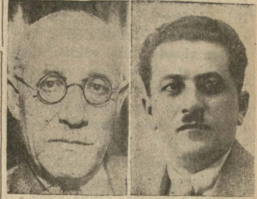
Kadrolarında mühim tenkihat yapılan Tütün ve Müskirat İnhisarları müdürleri

Müskirat İnhisarında Müskirat İnhisar idaresinin dün memurine tebliğ edilen yeni