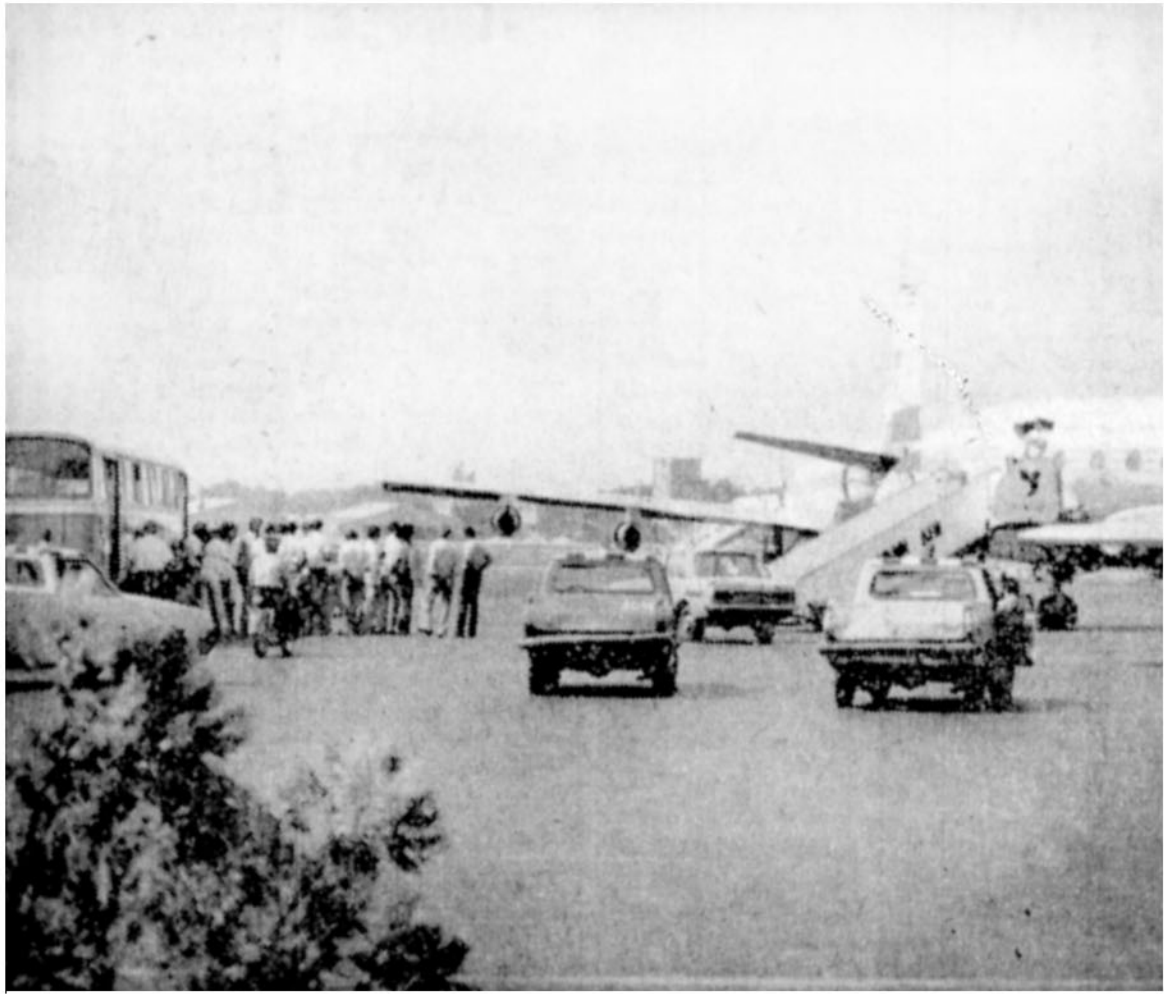
هواپیمای سووری که مسافران آن که به گروگان گرفته شده بودند بر باند فرودگاه مهرآباد دیده میشود

دهها مسافر هواپیمای سووری به گروگان گرفته شدند