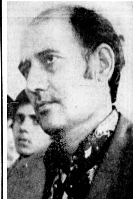
روح الله میریاز و دو یسواک

او دو مبارز را آنقدر شکنجه کرده که زیر شکنجه شهید شده اند