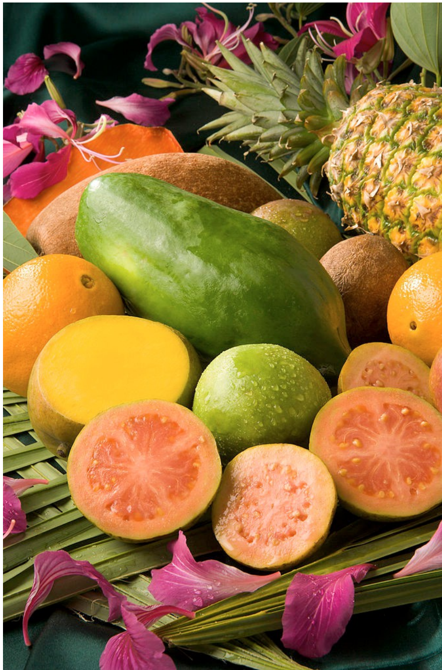
[[File:ARS tropical fruit no labels.jpg]]