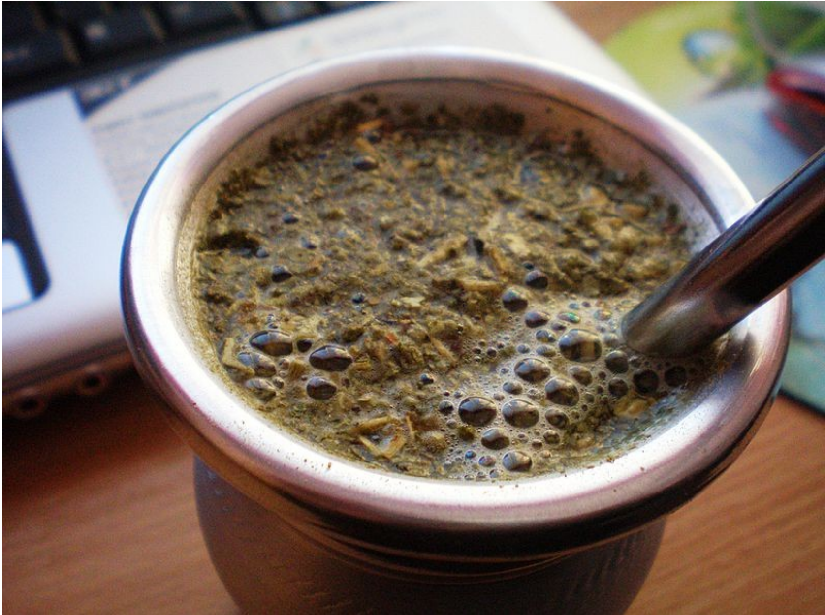
Mate („exotisches“ Getränk!?)

[[File:Kaa mate.JPG]]