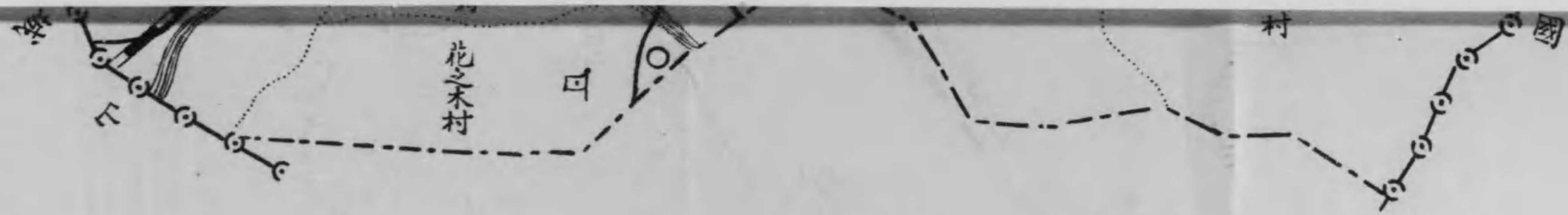
縮尺二十万分之一