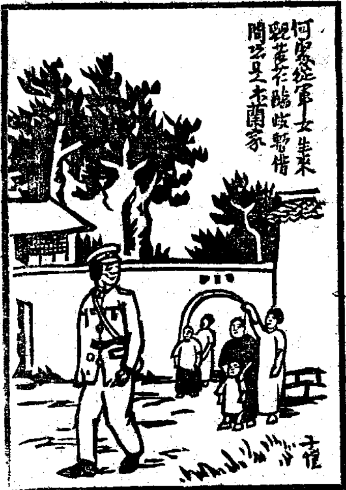
何處從軍女生來 親若在臨收暫借 問以是木蘭家

但是德意目前的互相勾結，並不一定取着同樣狂吠的姿態，亦許還像慕尼黑會議時一樣，以紅臉白臉的姿態出場。因爲希脫拉抓住了張伯倫的弱點——懼怕戰爭的弱點，一面由墨索里尼出來張牙舞爪，一面自由出來假裝調人，或者第一步僅要西班牙，而謊言担保不提出過分要求。只要張伯倫上了圈套，西班牙到手，法國已被三面包圍的時候，再來第二步要求。在這點上，完全決定於法國了。