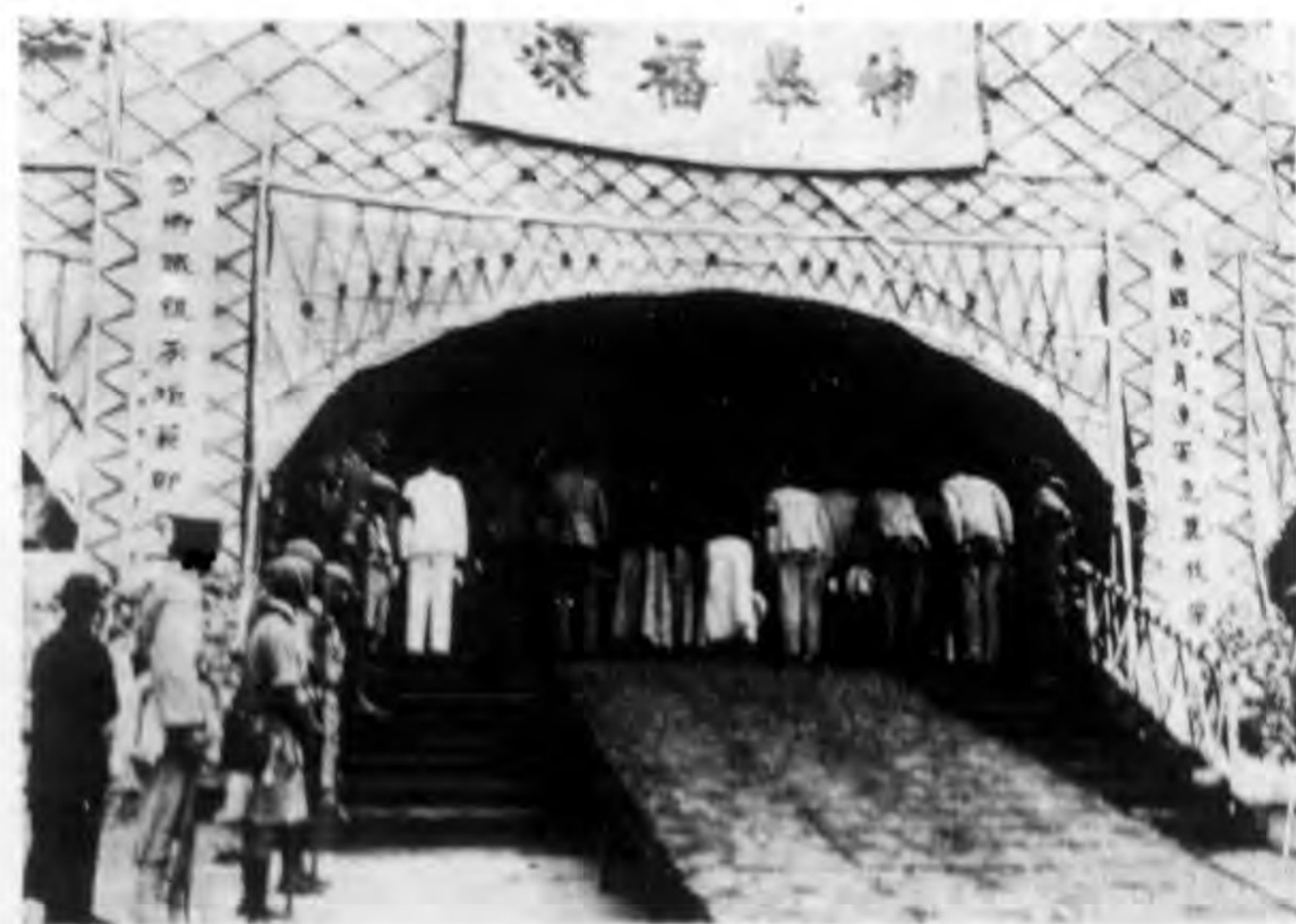
譚延闓先生國葬典禮