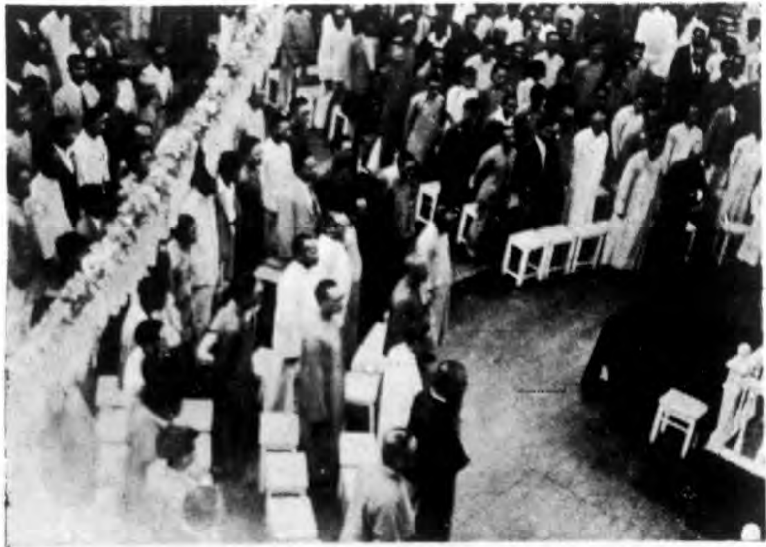
二十年九月九日中央黨部舉行 總理第一次起義紀念大會