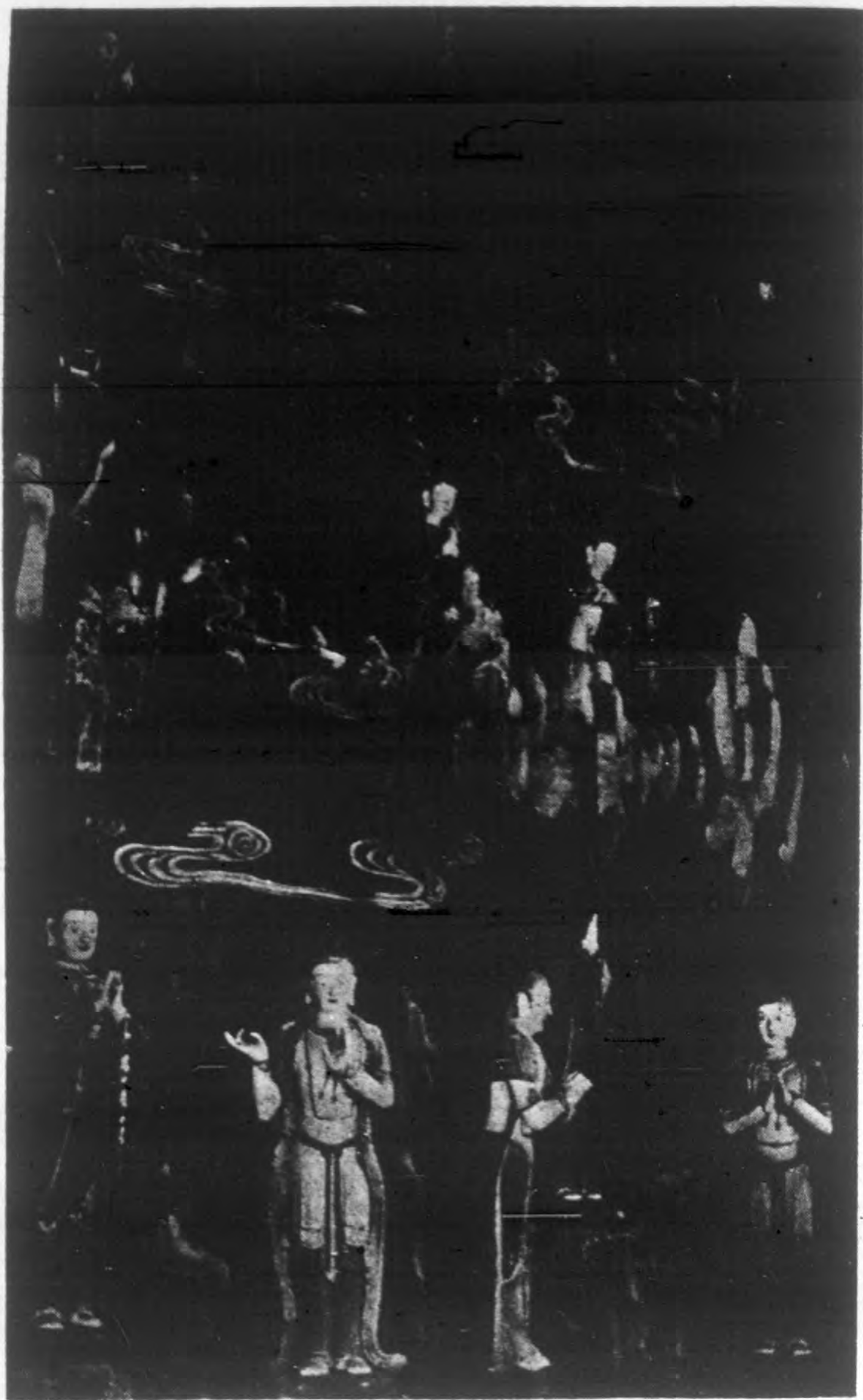
佛塑之天西小內園公海北