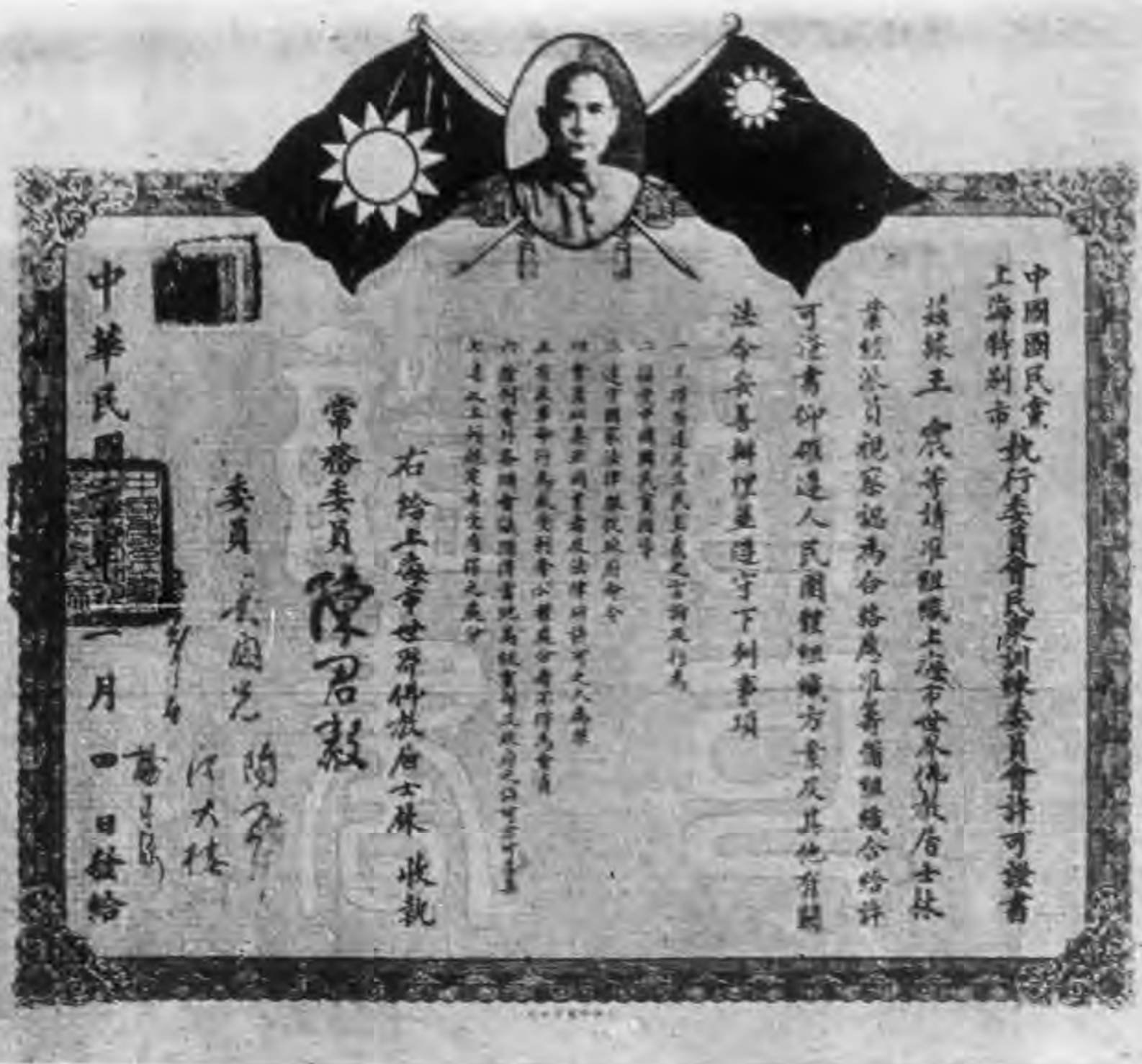
書證可許織組林本