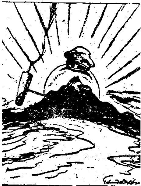
原載China's Weekly Review