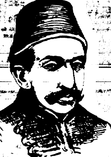
ABD-UL-HAMID, Sultan de Turquie.