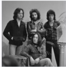
10CC - TopPop 1974