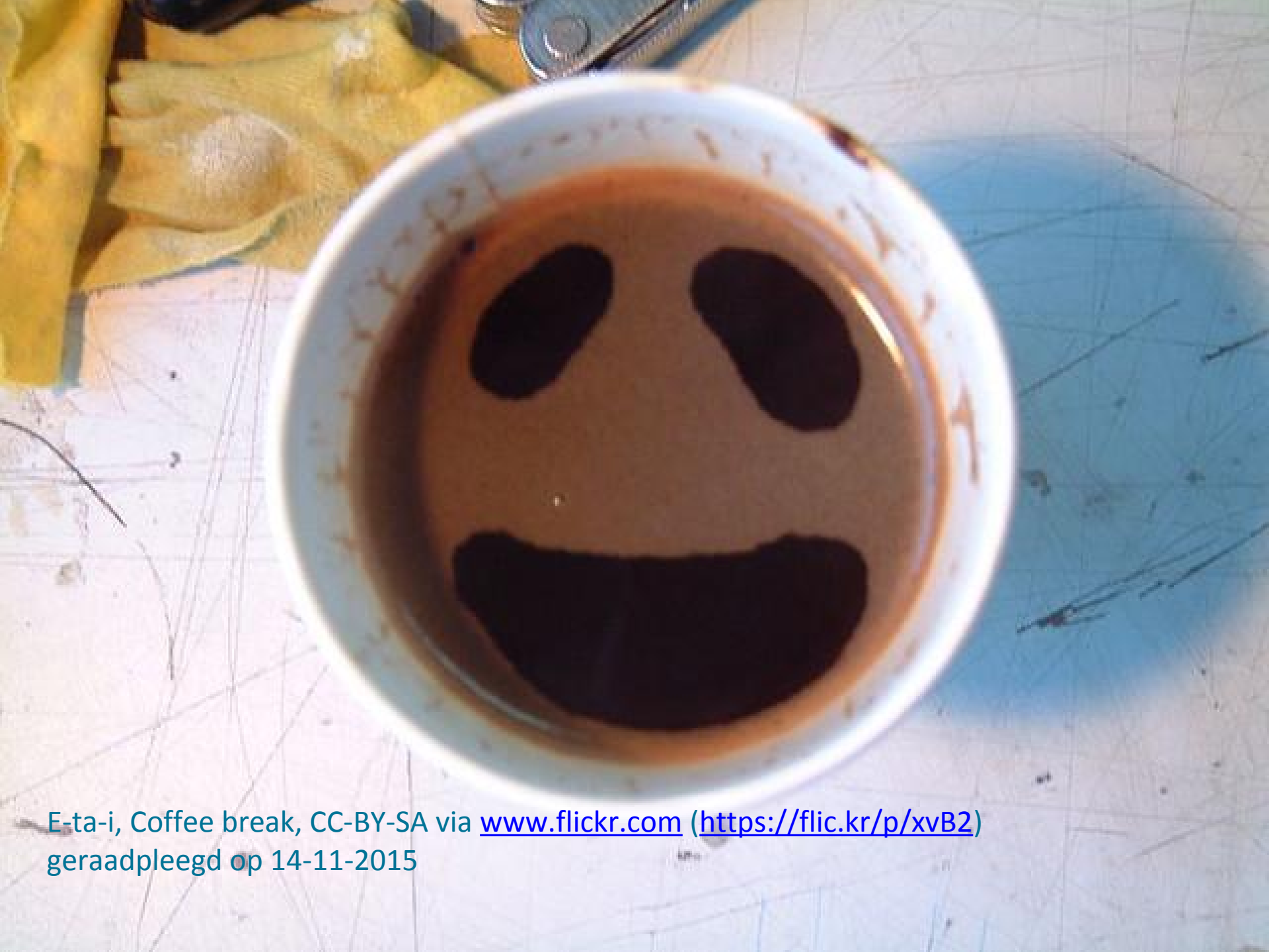
Coffee break, geraadpleegd op 14-11-2015