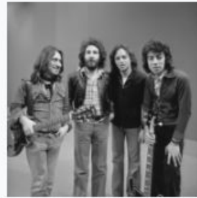
10CC - TopPop 1974