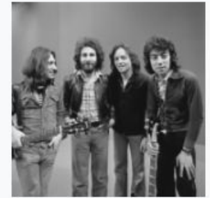
10CC - TopPop 1974