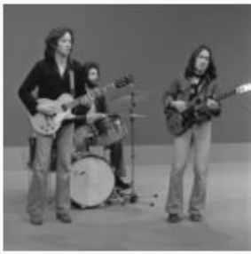
10CC - TopPop 1974