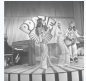
ABBA - Popzien 1973