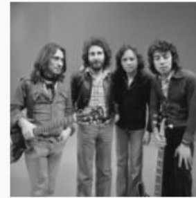
10CC - TopPop 1974