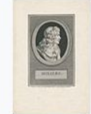
Molière-Jean-Baptiste Poquelin 1622-1673 Erfgoedcentrum Rozet 300 191 d 2 A-13.jpg