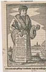
Laurens Janszoon Coster Erfgoedcentrum Rozet 300 191 d 2 A-01.jpg