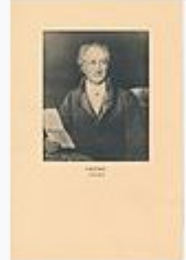
Johann Wolfgang von Goethe 1749-1832 300 191 d 2 A-23.jpg