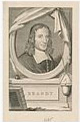
Gerard Brandt 1626-1685 Erfgoedcentrum Rozet 300 191 d 2 A-11.jpg 2,648 × 4,088; 2.82 MB