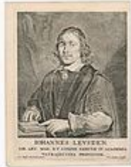
Johann Leusden 1624-1699