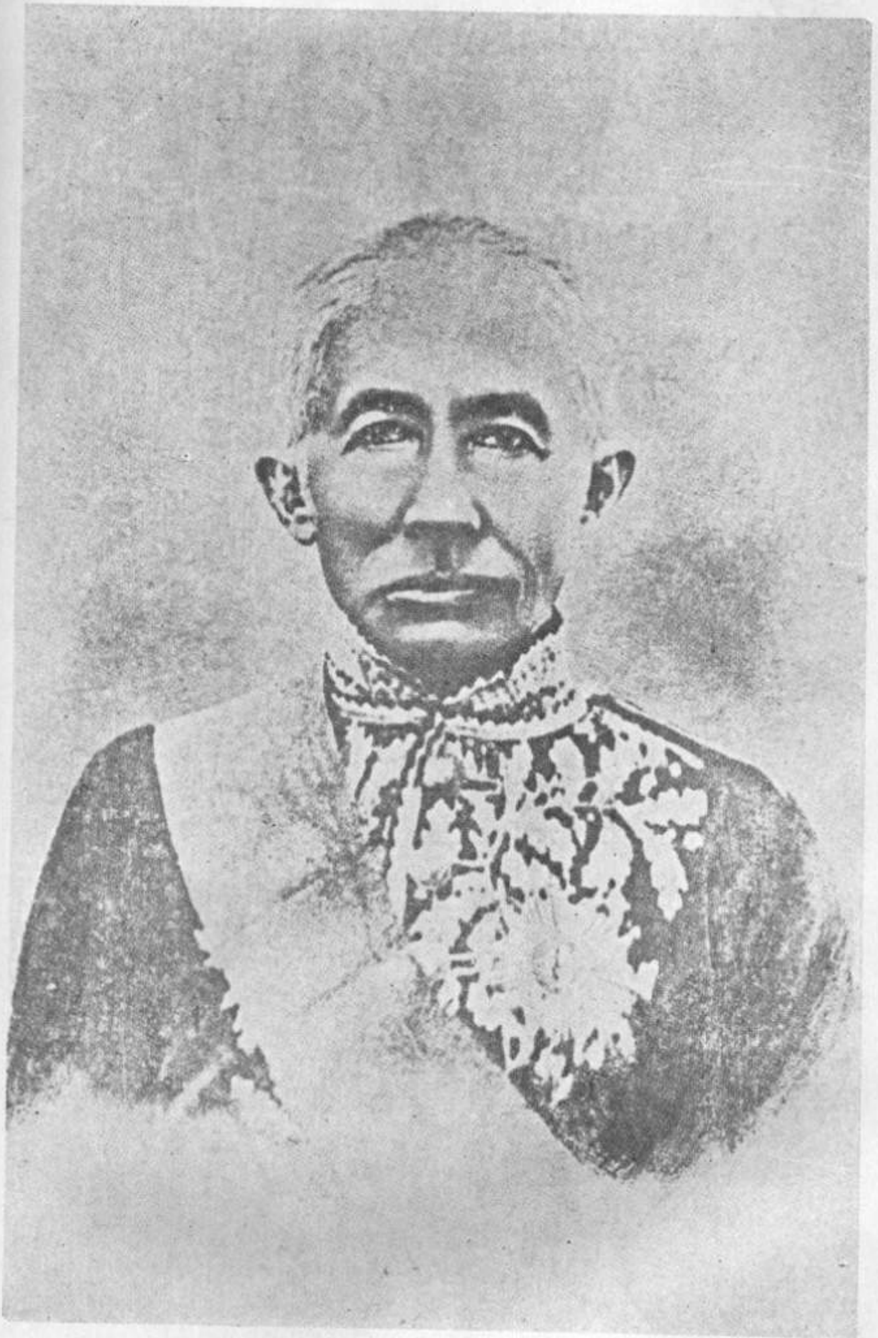
สมเด็จพระบรมชนกนาถ พระบาทสมเด็จพระจอมเกล้าเจ้าอยู่หัว