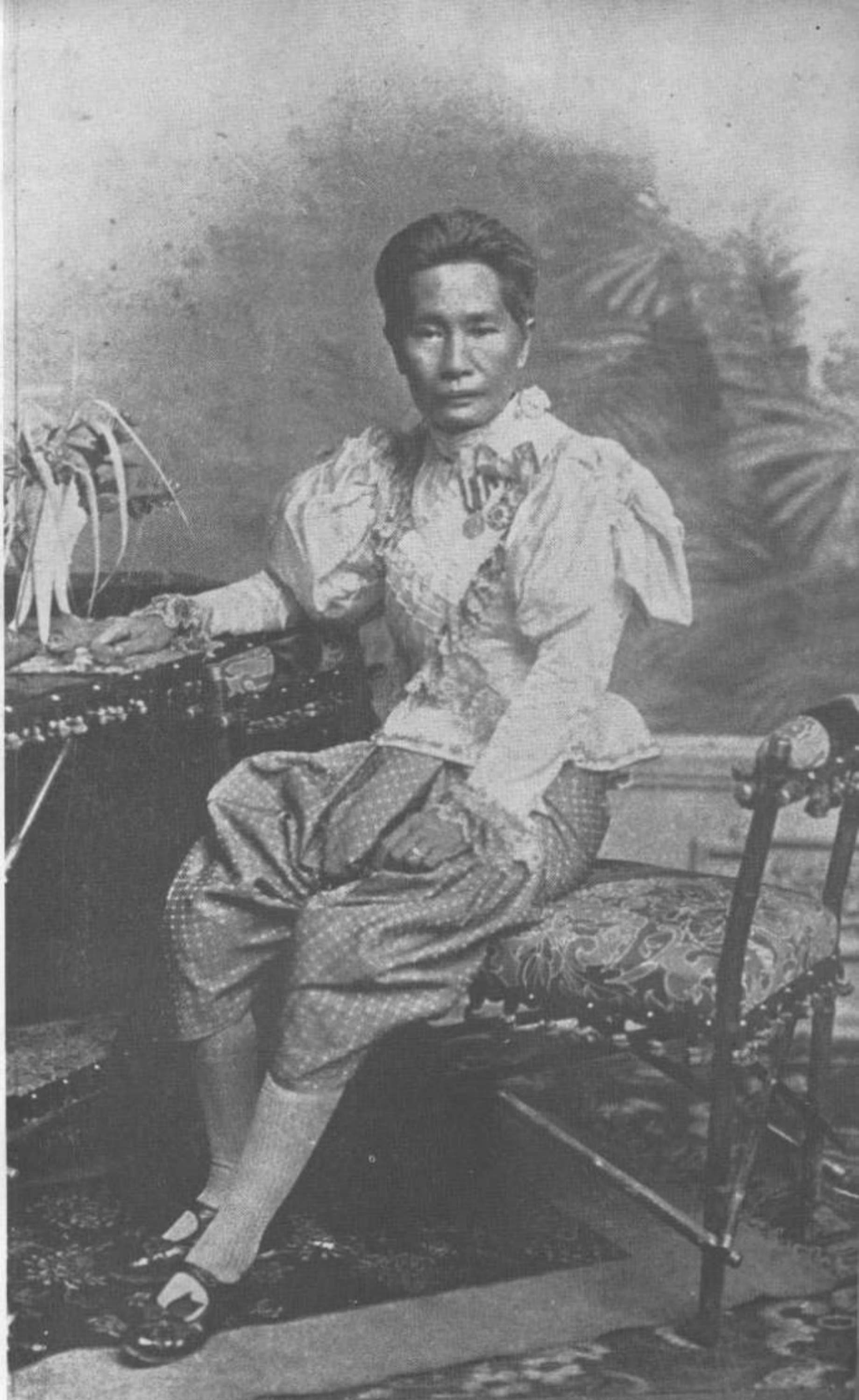
นางจอมมารดาชุ่ม รัชกาลที่ ๔