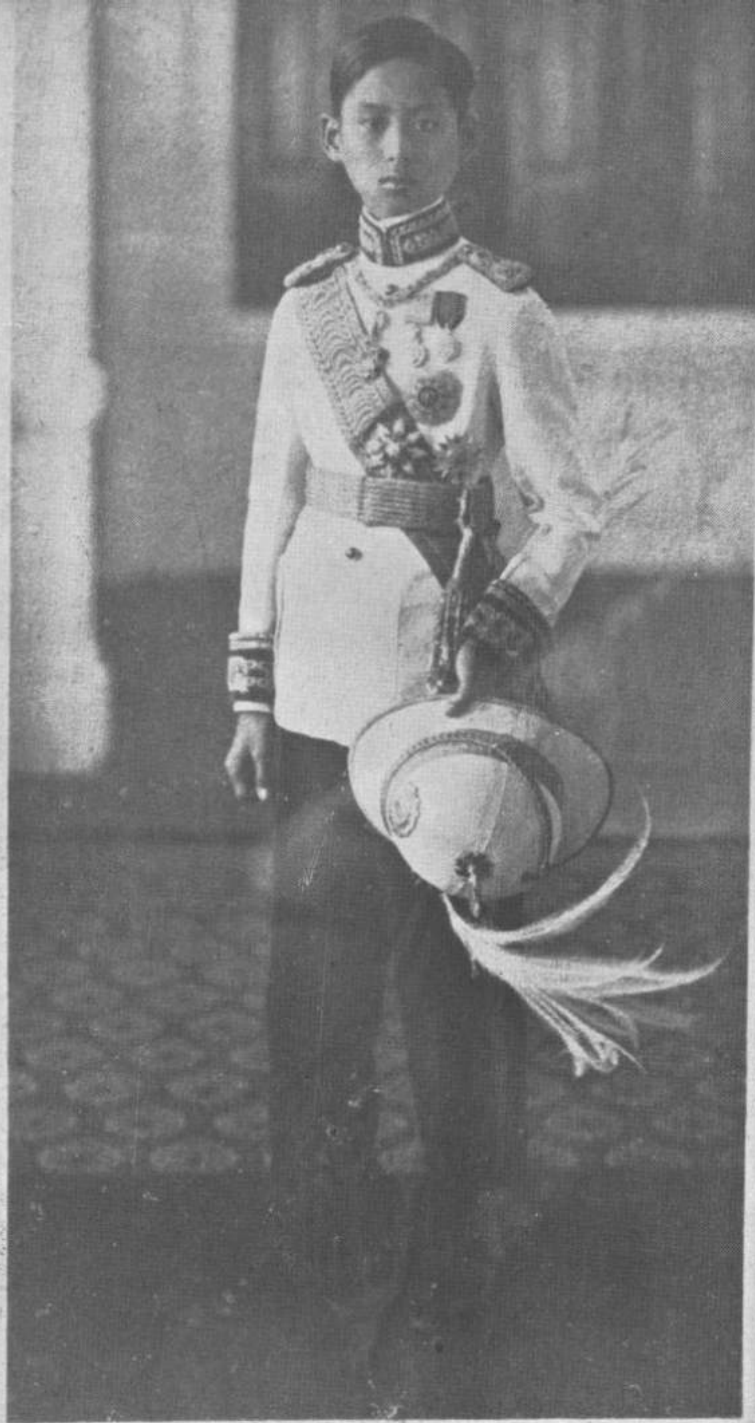
สมเด็จพระเจ้าบรมวงศ์เธอ เจ้าชายวชิรเกล้าเจ้าอยู่หัว ทรงพระเยาว์ในชุดเครื่องแบบทหารบก พ.ศ. ๒๔๖๑