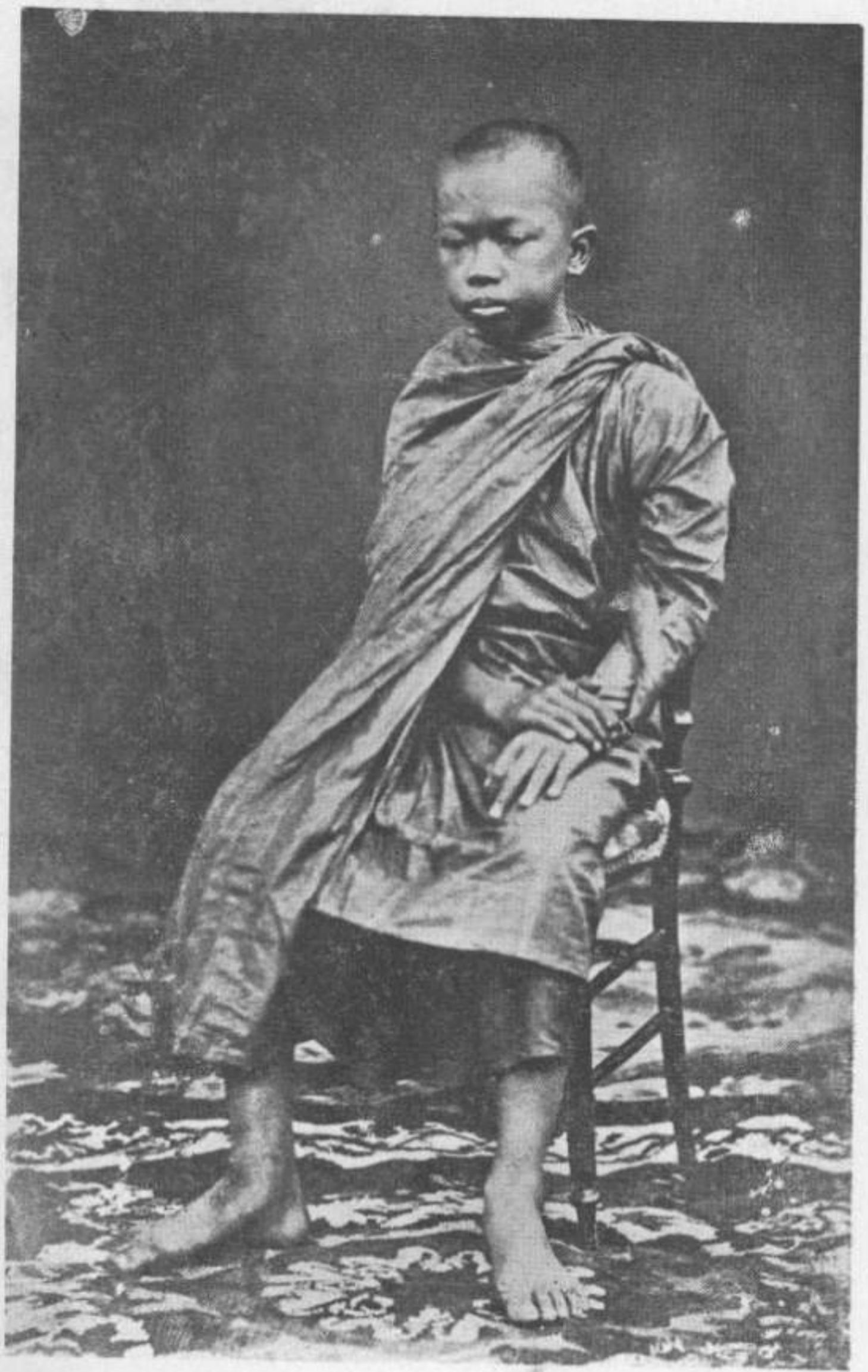
สมเด็จพระยาตำรงราชานุภาพ เมื่อทรงผนวชเณร