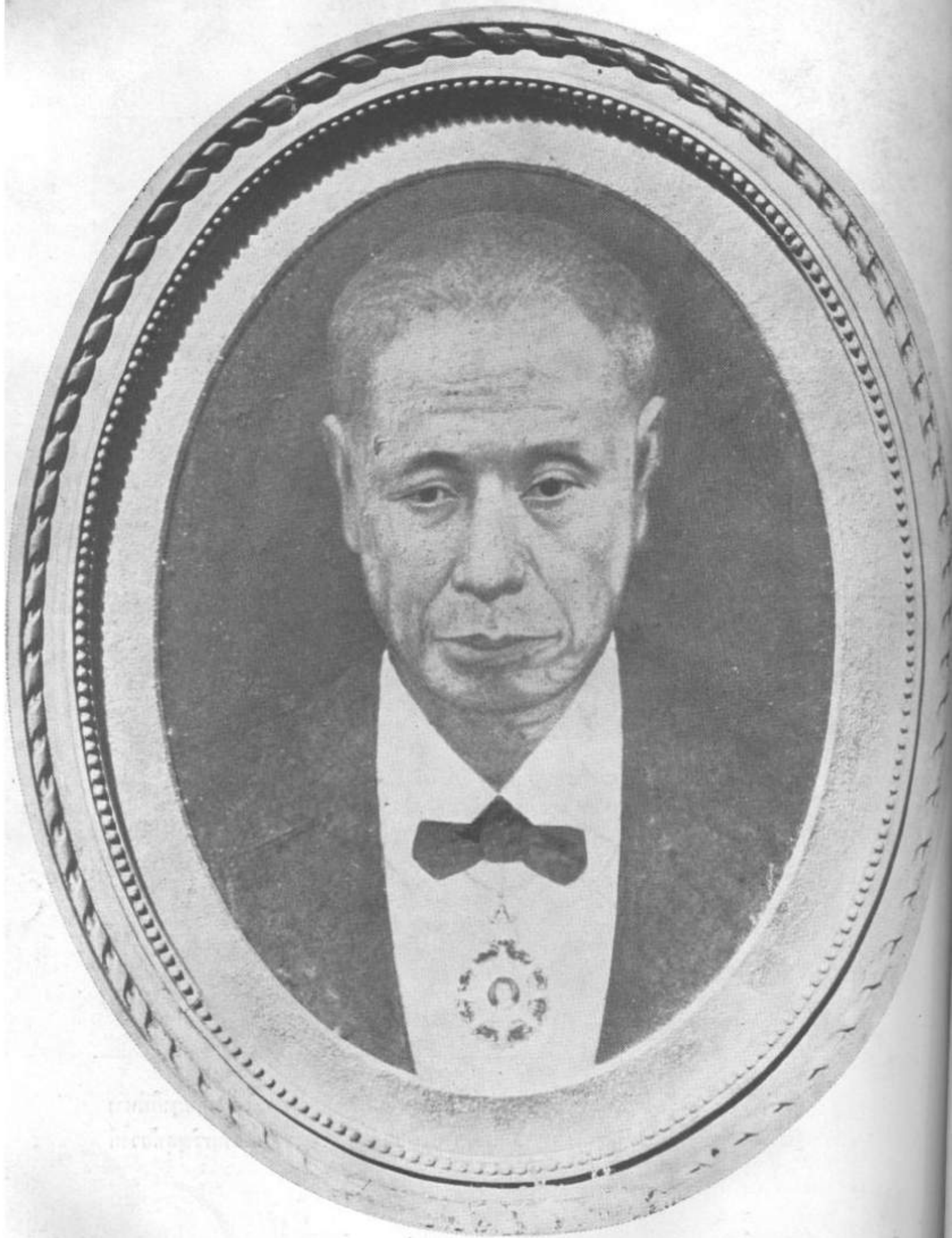
พระยาอัphanทริกามาตย์ “คุณตา”