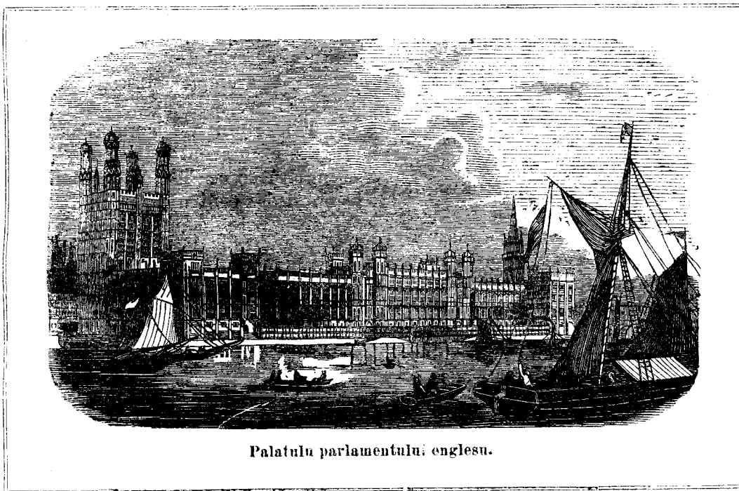
Palatulu parlamentului englesu.