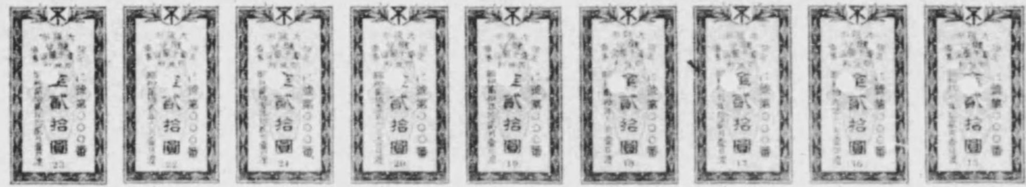
大阪市健康保險公債證書