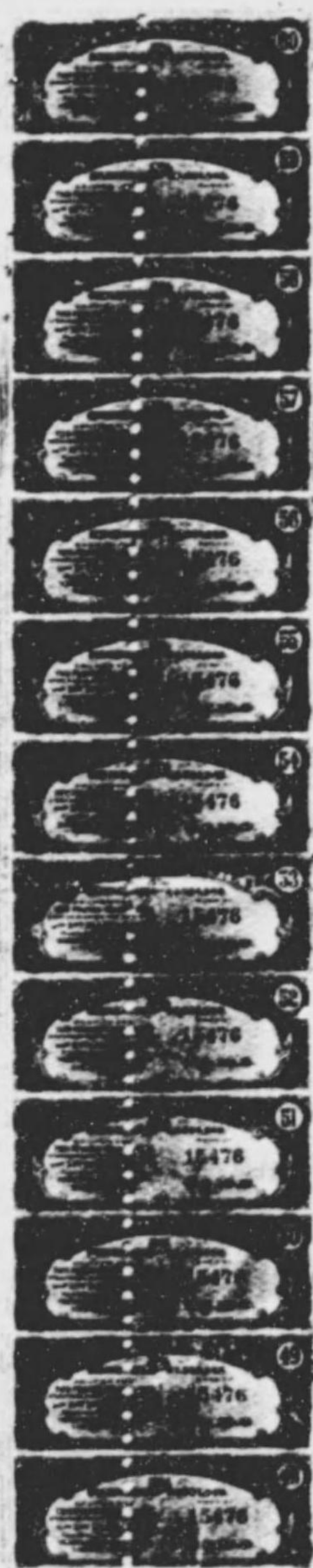
大阪市電氣軌道及水道事業公債證書