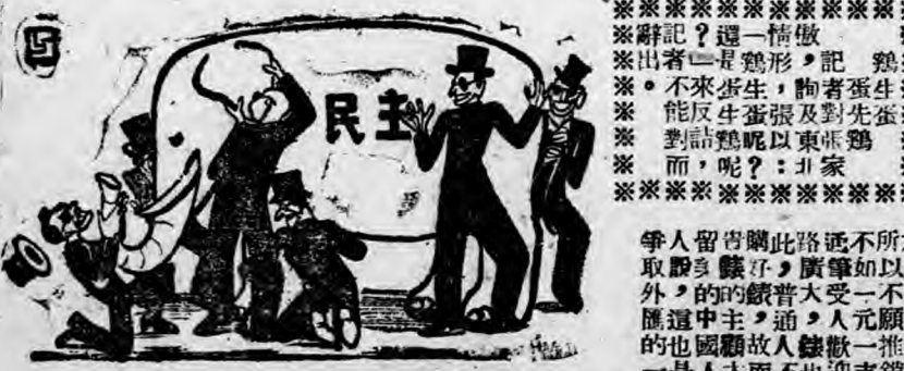
作生龍高 圖象摸子瞎