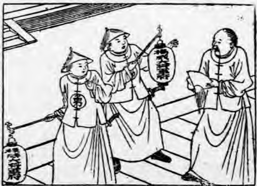
然季覺也裏心硬嘴他看別爺師邱

可，師婆子，這說已籍了也爲 全渾眼一子走了看極的多，忙也一把這 揀担，燈地拂波別。不胡面我不 呀看... 規單暗... 怎起結婚然