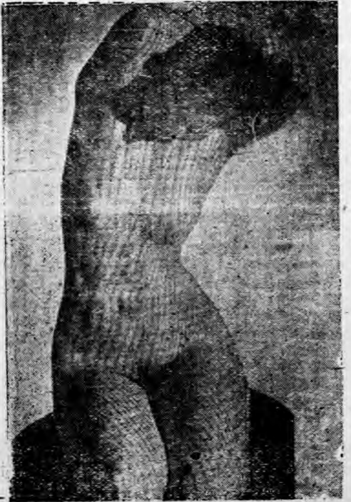
世界人體攝影名作。慈悵。

美國現在有許多科學家，研究如何用人造原子能來製造越洋火箭。這和以前用化學燃料製成的火箭不同。人造原子能火箭的優點，在於它不需要大量的燃料，而且速度非常快。這和以前用化學燃料製成的火箭不同。人造原子能火箭的優點，在於它不需要大量的燃料，而且速度非常快。