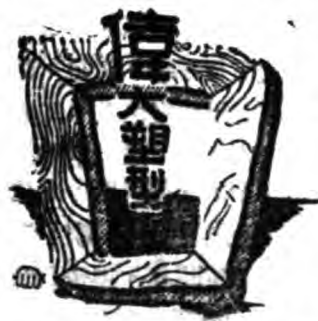
—— 無線電發明人馬可尼 ——

這時馬可尼發明無線電成功了，英國政府給了二十五萬美金的酬勞，這真是馬克尼意想不到的收穫，這是多麼驚人的消息！全世界都被這個新發明震驚了，各國報紙把馬克尼發明無線電的事蹟，用大字標刊出來，尤其是科學界更興奮得發狂，馬可尼的無線電，又創造了一個新的時代，任何地方的消息，都可以傳到全世界，他的成功是和歷史家傳不朽的，這無線電發明出的時候，他才是二十七歲的青年呢？