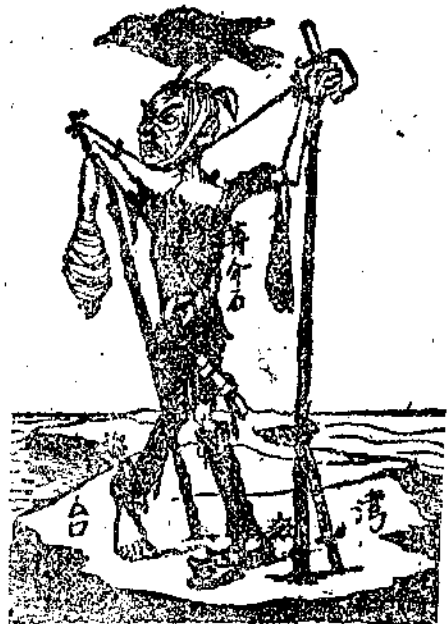
犯戰本日放釋魔麥