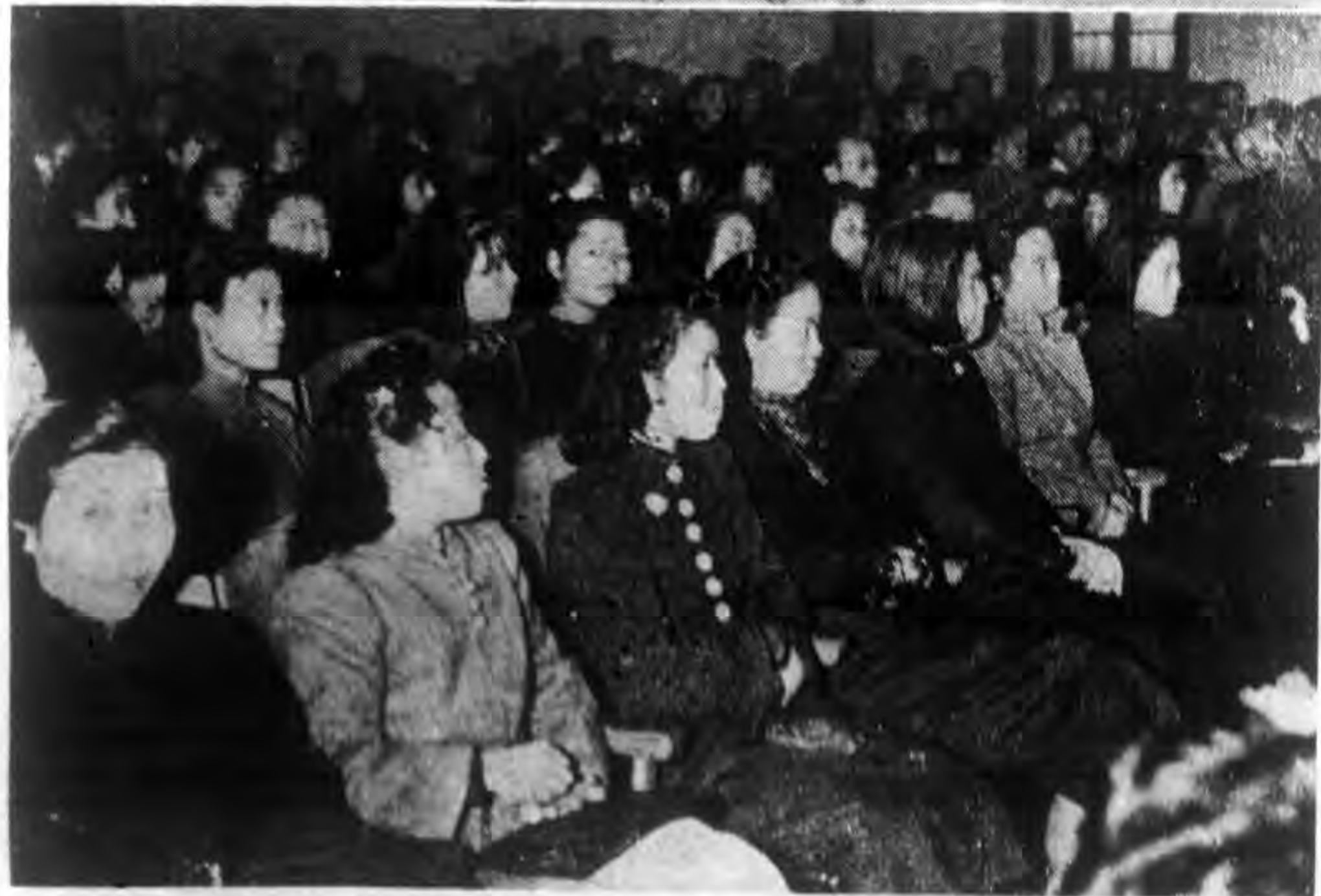
本會主辦中大學生日語演講比賽會場之盛況