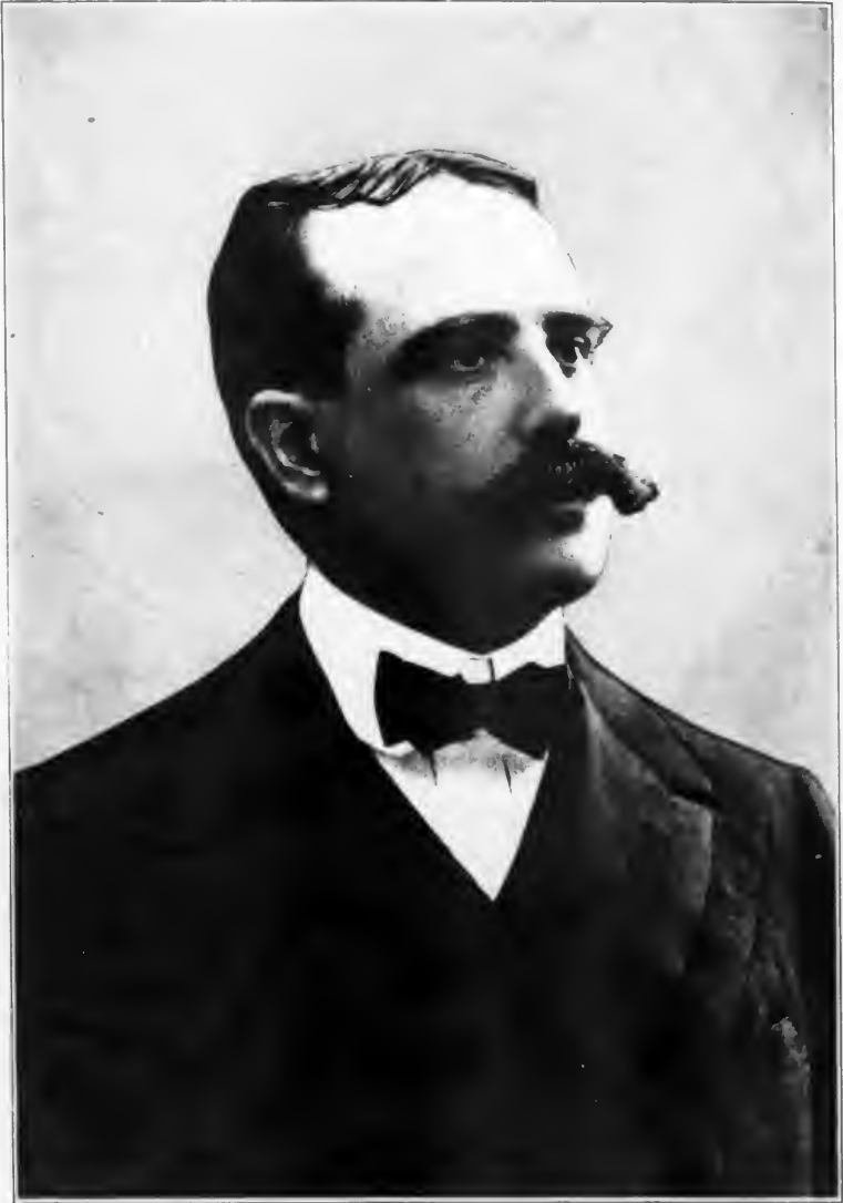
DOCTOR DON JOSÉ PARDO, PRESIDENTE DEL PERÚ.