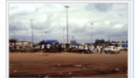
La gare routière et la Basilique de Yamoussoukro.