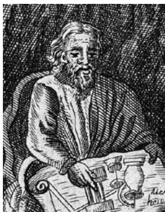
Heron von Alexandria (1. Jahrhundert n.C.)

zunehmend bessere Approximationen (wenn eine 0 dazukommt, kann man sich darüber streiten). All diese x_i sind rationale Zahlen, die zunehmend genauere Information über die durch die unendliche Ziffernfolge anvisierte Zahl beinhalten. Wir können also Ziffernfolgen als eine Folge von rationalen Approximationen auffassen (aufgrund von Lemma 3.5 (3) wissen wir bereits, dass man jede reelle Zahl durch rationale Zahlen approximieren kann). Eine fundamentale Beobachtung ist nun, dass Ziffernfolgen im Allgemeinen nicht die schnellste oder die beste Approximation einer Zahl geben, sondern dass häufig anders gelagerte Folgen besser sind. Deshalb werden die Approximationseigenschaften der reellen Zahlen über die fundamentalen Begriffe Folge und Konvergenz erfasst.