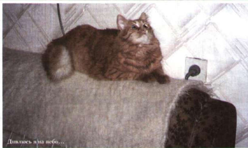
Дивлюсь я на небо...